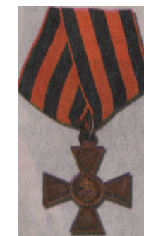
Исторический символ Первой мировой войны - Георгиевский крест

награждали солдатским знаком отличия ордена святого Георгия. Им прибавляли жалование, отменяли телесные наказания. Многие советские военачальники стали кавалерами ордена еще в Первую мировую войну. «Полный бант» (все четыре степени креста) имели Семен Буденный, Василий Чапаев и другие командиры гражданской войны. Полный георгиевский кавалер донской казак Константин Недорубов за отличия в боях с фашистами был удостоен звания Героя Советского Союза.