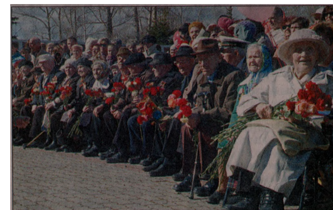
Ветераны войны были главными героями праздника.