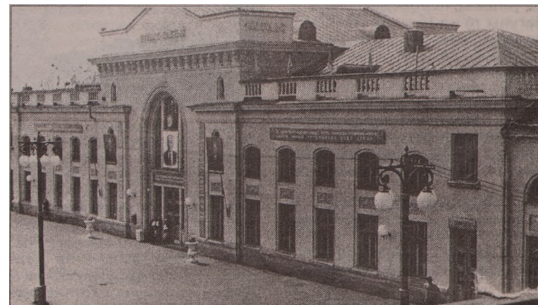
Нынешний вокзал в год постройки

- В этом году начался первый капитальный ремонт за всю историю вокзала. Раньше проводились только косметические. Крепкое было здание, но годы берут свое. В этом году закончим кафе «Встреча». Процесс идет поэтапно. Все зависит от выделения средств, хотя с этим проблем пока нет. Дату полного окончания ремонта даже загадывать не буду. Работы мно-