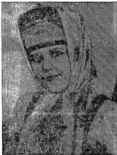
На снимке: литейница Придвинья в старинном традиционном наряде.