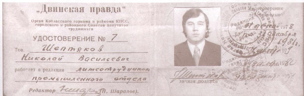
Так выглядело удостоверение лит/сотрудника «Двинской правды», семидесятые-восьмидесятые годы.