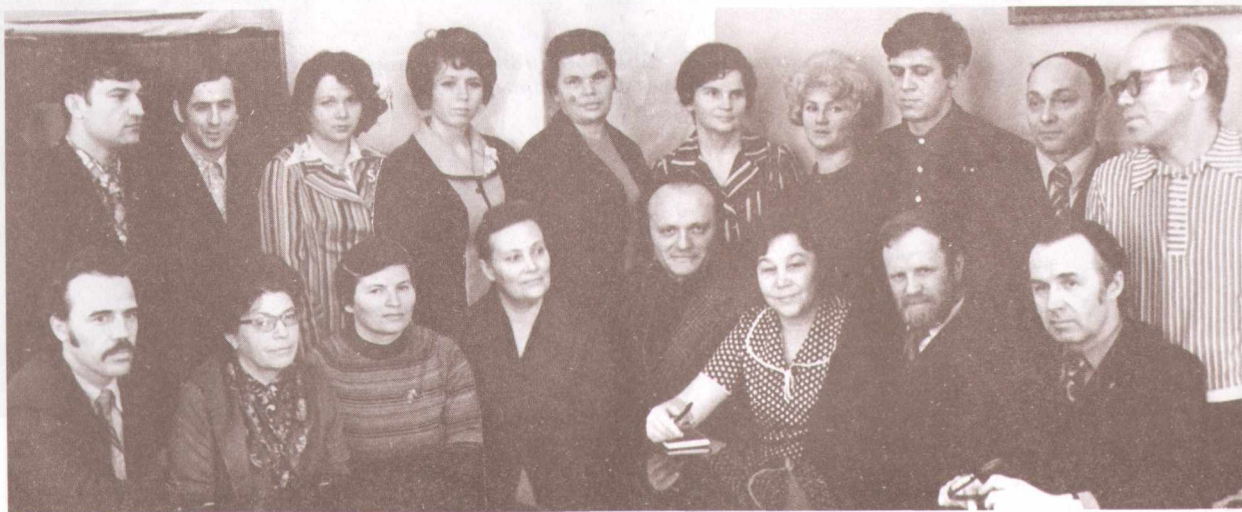
Работники «Двинской правды» на встрече с писателем Василием Беловым.