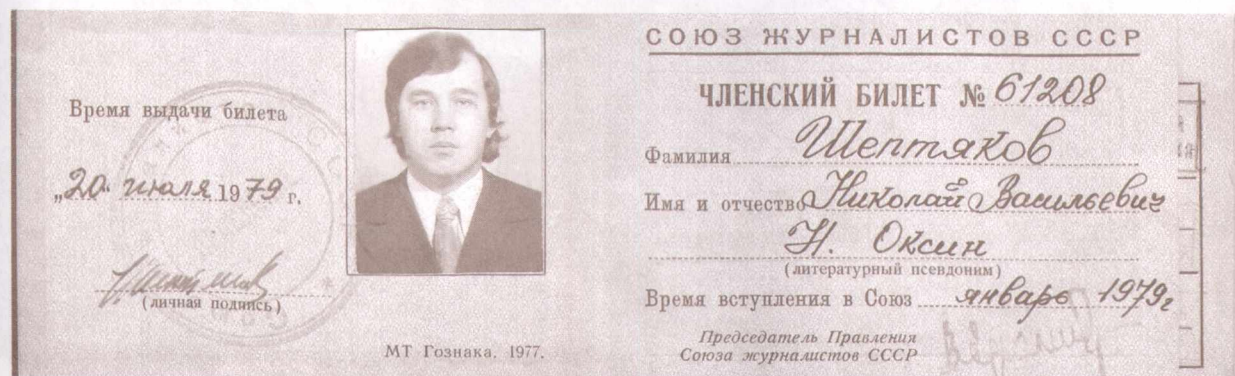
Советская реликвия: членский билет Союза журналистов СССР образца 1979 года.