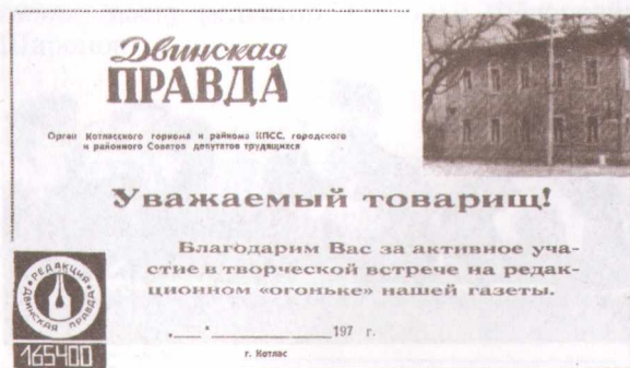
Бланк благодарности редакции за участие в «редакционном огоньке», семидесятые годы.