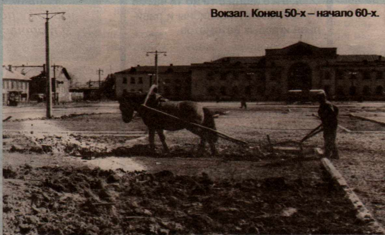
Вокзал. Конец 50-х – начало 60-х.

Фото и материал предоставлены сотрудниками Котласского музея.