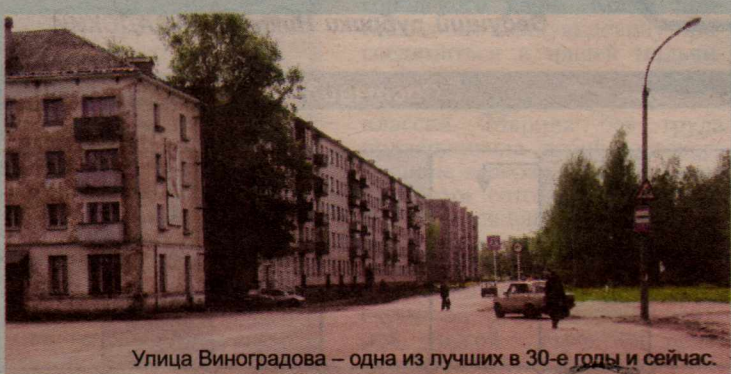
Улица Виноградова – одна из лучших в 30-е годы и сейчас.