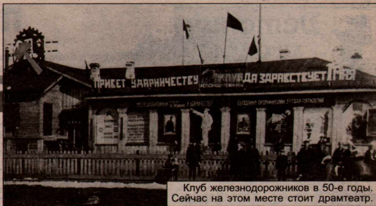
Клуб железнодорожников в 50-е годы. Сейчас на этом месте стоит драмтеатр.

Путешествуя по Северу в конце XIX – начале XX веков, русский писатель А. Кольчев побывал в Котласе. Самые интересные наблюдения он занес в записную книжку. Выдержки из нее сегодня мы и предлагаем вашему вниманию.