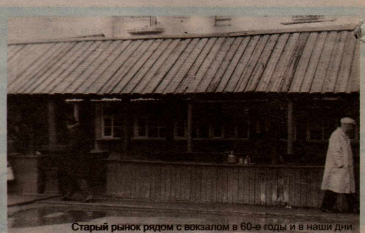
Старый рынок рядом с вокзалом в 60-е годы и в наши дни.

Появление излишков сибирского хлеба в балтийских портах окажет понижающее действие на продажные цены как хлеба сибирского, так и хлебов Европейской России. Но эти невыгодные для нашей хлебной торговли последствия могли бы быть в значительной мере ослаблены, если бы сибирский хлеб нашел для себя выход на мировой рынок не через балтийские порты, откуда отпуск за границу хлеба совершается в значительных размерах, а через такой порт, где отпуск еще ничтожен. Таким портом для Сибири делается Архангельск в случае проведения железной дороги от Перми до Котласа».