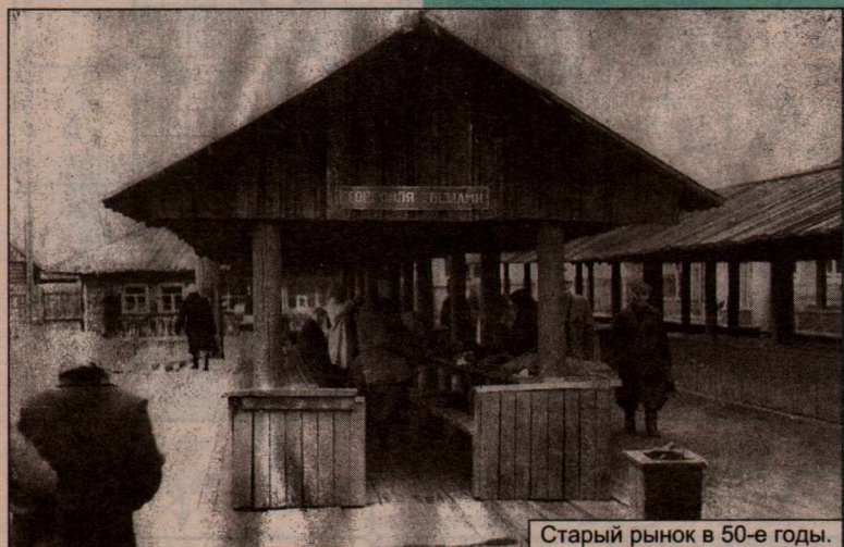
Старый рынок в 50-е годы.

волосые, они и держали себя с достоинством: не совали пассажирам молоко и яйца, стараясь перебить друг у дружки покупателя, не кричали, не суетились. Даже вид у них был какой-то гордый. Коротеньких, приземистых баб, напоминающих тумбу, столь частых в средней полосе России, совсем было не видать.