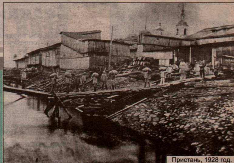
Пристань, 1928 год.

— Оно и понятно отчего, — отвечал тот. — Крепостного гнета не видали. И предки их никогда не были крепостными. Народ свободный, вольный из поколения в поколение. Ведь это потомки новгородских ушкуйников, а те уж, бесспорно, были