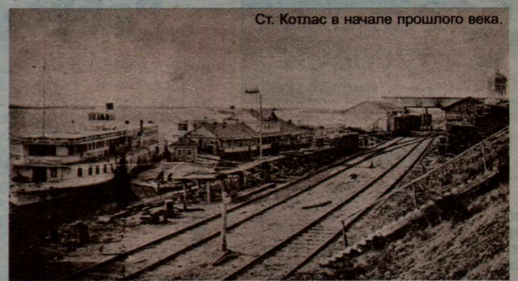
Ст. Котлас в начале прошлого века.

Действительно, более идеальную пристань представить себе трудно. Наш пароход подошел к берегу вплотную. Берег высок настолько, что никогда не заливается водою и тут же идет обширное пологое и отлогое пространство, где, по всему вероятно, быстро вырастет торговый город, как только сюда пойдет сибирский хлеб. Здесь хлебные амбары могут быть расположены вдоль самого берега реки, так же, как и линия железной дороги. Таким образом, хлебохранилища будут непосредственно соприкасаться с бортом судна и с вагонами. Словом, здесь все природные условия для того, чтобы и хранение хлеба и пе-