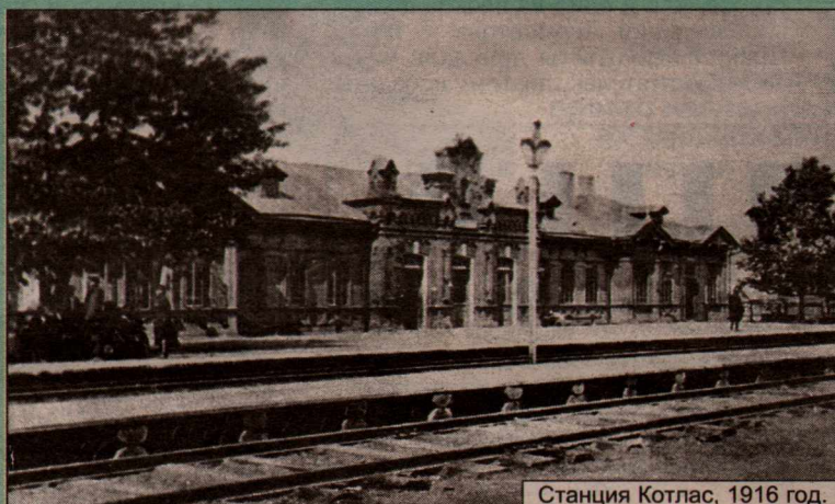
Станция Котлас, 1916 год.

Посмотреть на пароход вышли бабы и ребята. Мужиков было 2-3, очевидно, они были на работе, но баб было довольно много. Некоторые из них вынесли продавать пассажирам молоко в кринках, другие стояли, заложив руки под передник, подвязанный под самой грудью. Босых было почти не видать. Бабы были в ситцевых сарафанах, но у этих сарафанов и рукава и рубахи были пестрые, ситцевые. Платки головные также ситцевые, яркие. Я невольно залюбовался на этих баб. Высокие, стройные, темно-