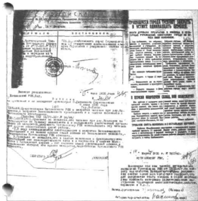
Сохранившиеся с 30-х годов прошлого века документы.

году составит 40 тысяч тонн. Как правило, закрытию церкви предшествовали «просыбы» трудящихся. Великоустюжские и котласские газеты 30-х годов пестрели заголовками типа «Трудящиеся города требуют закрыть в Устюге одиннадцать церквей». Требования трудящихся города, безусловно, должны были поддержать и удовлетворить горсовет и окриспол-