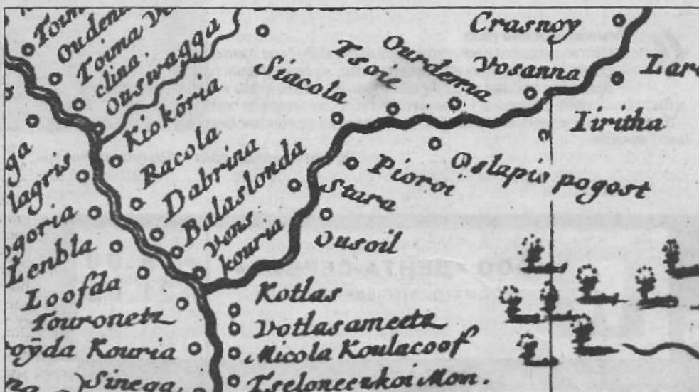
Карта 1634 года, на которой указаны населенные пункты Котлас и Пирой.

Хотелось бы, чтобы наш город украшал памятник или памятный знак святому Стефану Пермскому, с чьим именем связана история нашего города, который до сих пор исчисляет свое рождение с 1917 года, а мог бы в 2009 году отмечать 630-летний юбилей.