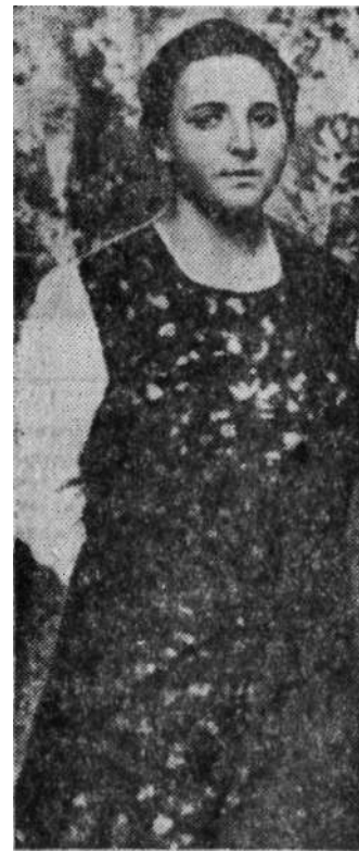
На снимке: Надежда Сергеевна Аллилуева, вторая жена Сталина (фото из архива автора), 1930 год.