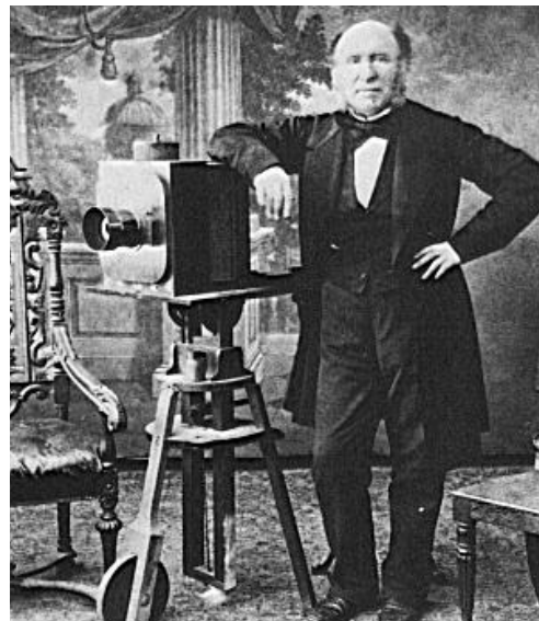
Фотограф середины XIX века

ец барон Карл Генрих Вильгельм фон Брандис и пруссак Карл Фридрих Герман Локке. «Фотографы Локке и Брандис, отъезжая в скором времени из Архангельска, приглашают желающих иметь фотографические портреты адресоваться к ним ежедневно при всякой погоде» 9 .