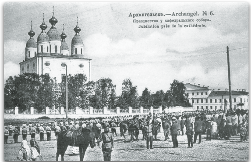
Архангельскъ.—Archangel. № 6. Празднество у кафедральнаго собора. Jubilation près de la cathédrale.