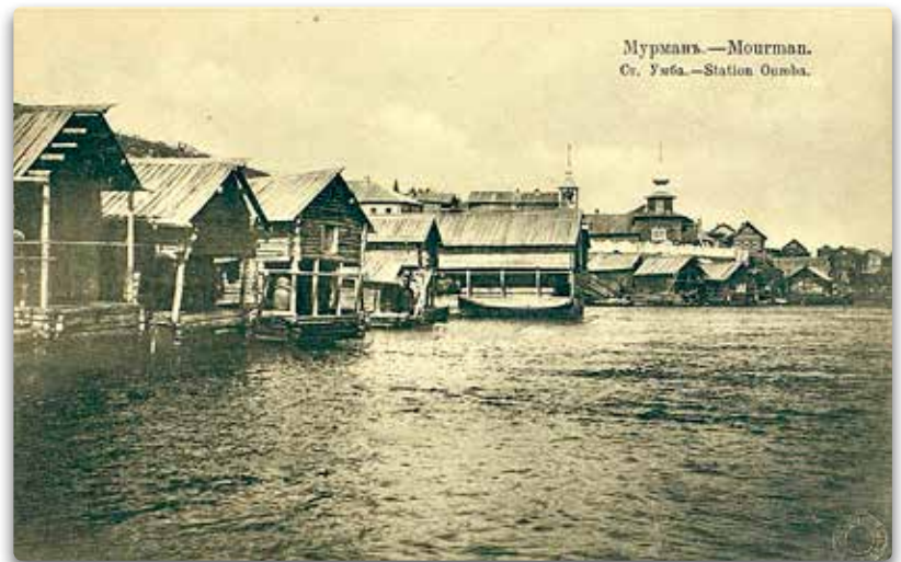
Мурманъ.—Mourman. Ст. Умба.—Station Oumba.