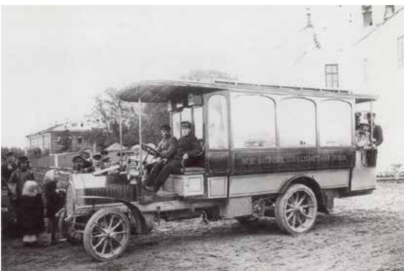
Один из первых автобусов Архангельска. 1907 год