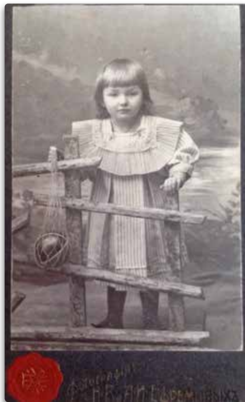
Девочка с мячом. Фотоателье Н.В. и А.И. Ефремовых

В 1910 и 1913 годах в Архангельске также прошли всероссийские вы-