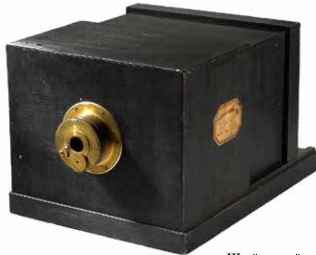
Швейцарский фотоаппарат для дагерротипии, выпускавшийся с 1839 года

В 1860 году в городе «гастролировали» еще два фотомастера — австри-