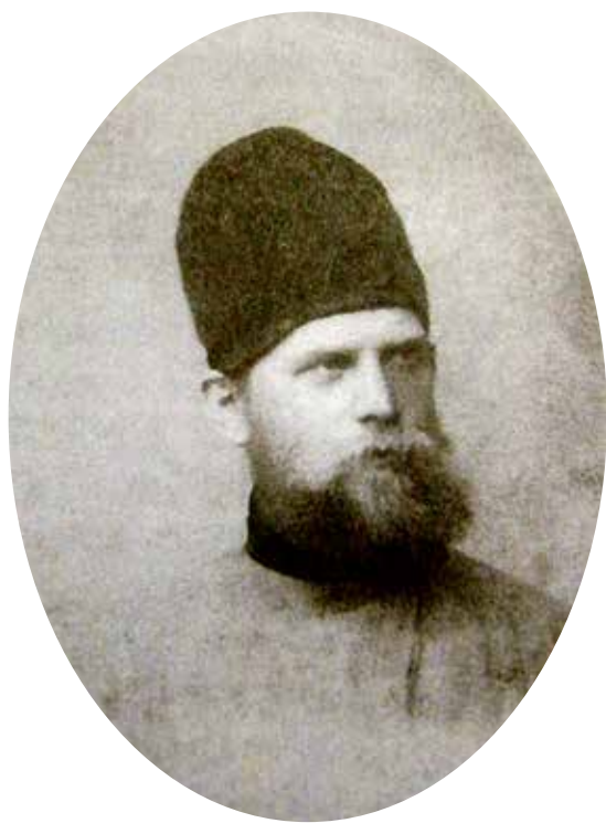
Яков Иванович Лейцингер. Автопортрет. 1888 год