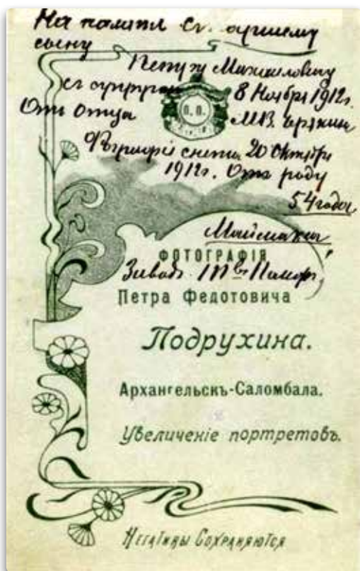
Визитка фотографии П.Ф. Подрухина

В начальный период своей деятельности Общество насчитывало до полусотни членов: «например, в 1915 году — два почетных, один пожизненный и 46 действительных» 65 . Со временем АФО основало собственную профильную библиотеку — книги и руководства по фотоделу, альбомы, периодика.