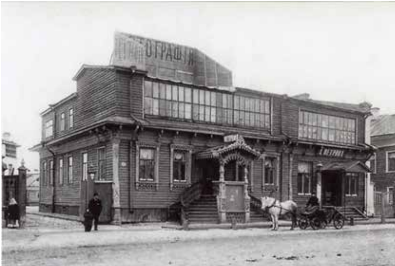
Фотоателье Я.И. Лейцингера на Псковском проспекте. Начало XX века

Фотографии Я.И. Лейцингера из фондов Государственного архива Архангельской области (ГААО)