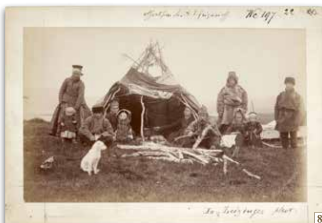
La. Leizinger phot. 8