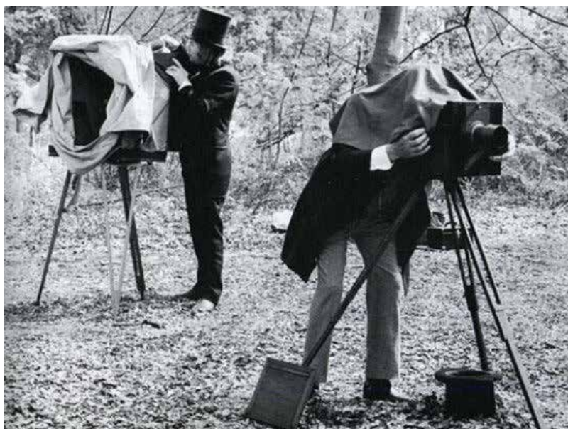
Фотографы на натуральных съемках

В августе 1863 года в Архангельск на имя губернатора из Департамента исполнительной полиции МВД поступил запрос о том, «сколько в губернии существует фотографических заведений, с разделением оных по городам» 14 . Ответ гласил: на данный момент — три, все в Архангельске. Далее