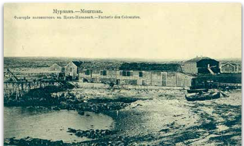
Мурманъ.—Mourman. Фабрика казенныхъ вѣ. Цукъ-Шанаяскъ.—Factorie des Colonates.