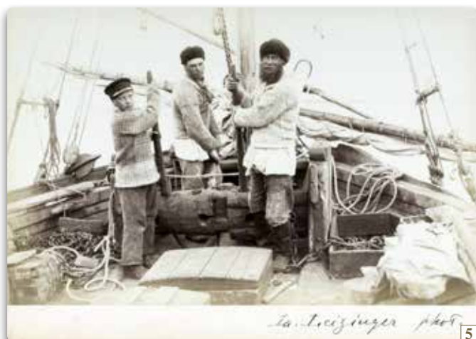
La. Leizinger phot. 5