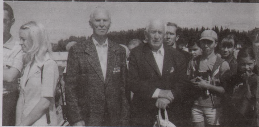
Ветераны – фронтовики на родине адмирала в д. Медведки.

Воздавая дань выдающемуся земляку-адмиралу, группа ветеранов комитета подготовила фотоальбом «Адмирал Флота Советского Союза Кузнецов Николай Герасимович.