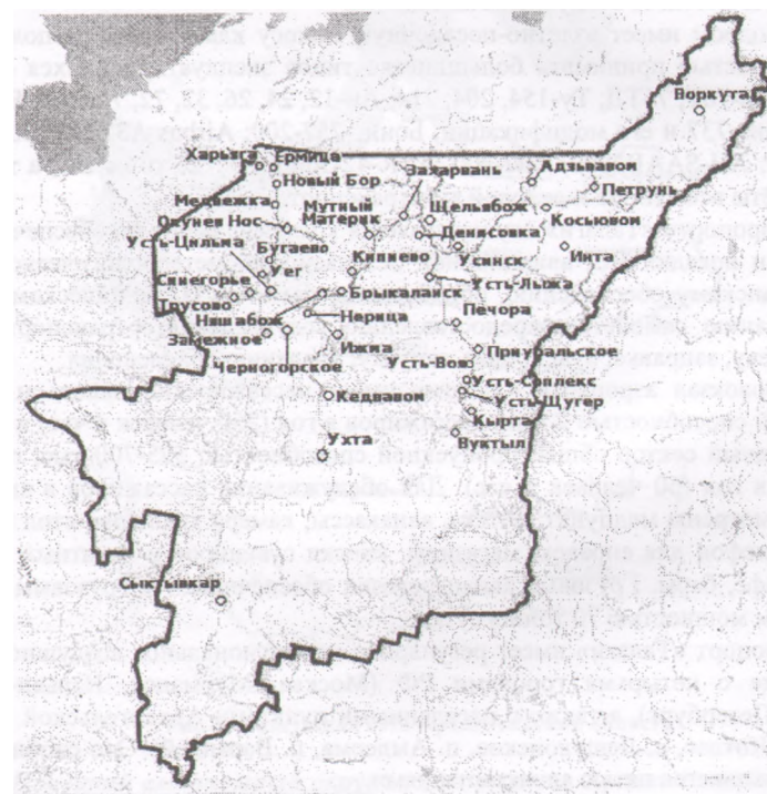
Рис. 1. Воздушная сеть Республики Коми

Основным авиаперевозчиком между муниципальными образованиями на территории Республики Коми является государственное унитарное предприятие «Комиавиатранс». В его состав входят аэропорты федерального значения (Сыктывкар и Воркута), республиканского значения (Ухта, Печора, Усинск, Усть-Цильма, Инта), а также сеть вертолетных площадок местных воздушных линий (рис. 1).