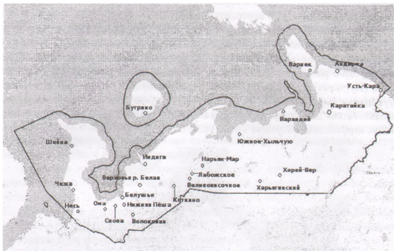
Рис. 3. Воздушная сеть Ненецкого автономного округа

ратайка, Усть-Кара, Варнек), посадочными площадками Харьгинского месторождения.