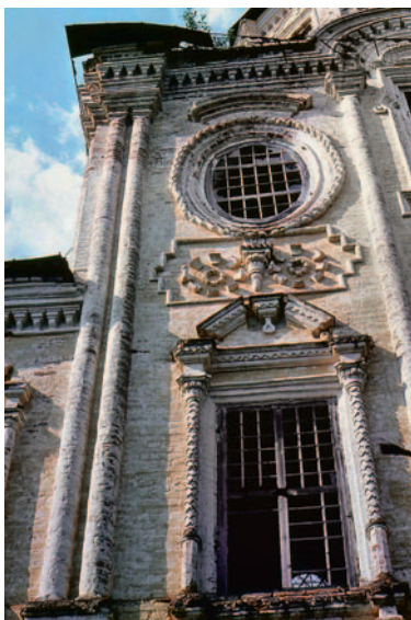
Иллюстрация 10. Покровская церковь на р. Луза Кировской обл. Фрагмент

(Троицкая церковь в с. Вожем; Благовещенская в с. Благовещение «сухонской трети», 1773).