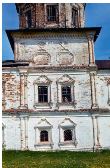
Иллюстрация 2. Христорождественская церковь, пог. Цилиба. Фрагмент

Трехчастная в плане, сильно вытянутая по продольной оси, с развитой трапезной и выступающей вперед колокольной (Иллюстрация 1), она имела предшественников не в Устюге, а в Москве, причем и там весьма многих (храм Николы на Болвановке, 1700–1712). Однако, если автор последнего, известный зодчий Осип Старцев, употребил по тем временам уже консервативное (тем более для Москвы) решение верха как «горки» кокошников с луковичным пятиглавием, то в Цилибе четверик венчается большим восьмериком. В связи с ним снова приходится указывать на московское влияние, ибо Великий Устюг этого варианта «восьмерика на четверике» почти не принимал. Вместе с тем общеизвестно, что в Москве и Подмоскovie большой (широкий) восьмерик при-