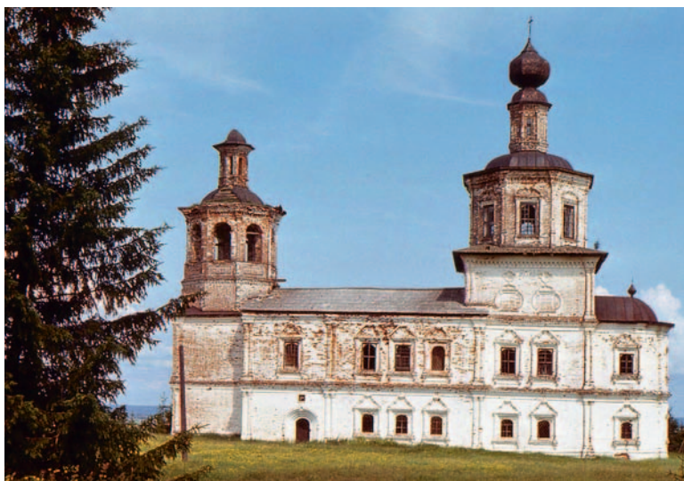
Иллюстрация 1. Христорождественская церковь, пог. Цилиба Архангельской обл.

и по красочной гамме. Но здесь изразцы собраны во фриз 2 , а среднее алтарное окно получило изразцовую же рамку, хотя и вписанную в однотипный с остальными кирпичный наличник.