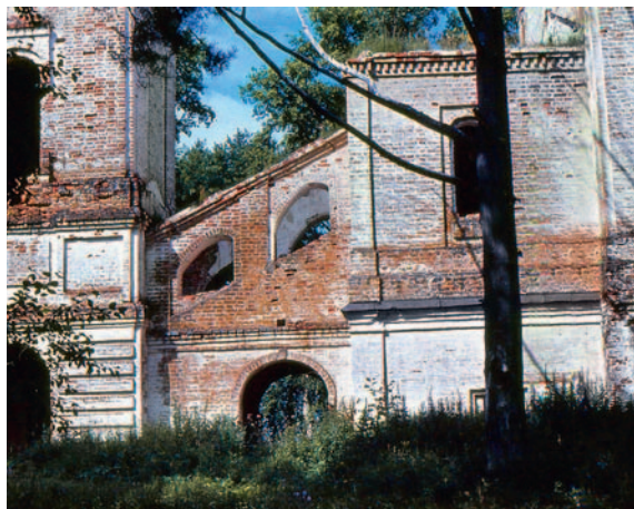
Иллюстрация 7. Успенская церковь близ д. Синега Вологодской обл. Фрагмент

на р. Юг трапезная, правда, намного длиннее — на пять осей окон. Если, однако, искать более важное композиционное различие, то оно состоит в постановке колоколен. Они то примыкают к западной стене трапезной, то соединены с трапезной крыльцом либо притвором на арке, примеры чему находим в Вотлажке и Вожеме, а также в очень долго (с 1758 по 1826 г.) строившейся Успенской церкви близ д. Синега (Иллюстрация 7). Кстати, последнее гораздо более присуще устюжской «периферии», нежели самому Устюгу, где представлено почти исключительно в Ильинской церкви (1695–1745). В любом случае колокольня подчиняется строго осевой композиции здания, уже не получая нередкого ранее сдвига (кроме Михаило-Архангельской церкви с. Бобровниково на Двине, 1778).