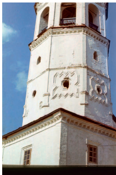
Иллюстрация 13. Спасо-Преображенский собор в с. Яренск. Колокольня

линии продольной оси происходит не только за счет трапезной, но и сооружения впереди колокольни крыльца. Порой входная часть превращается в весьма сложную композицию с прорезанным аркой притвором и выдвинутым по той же оси крыльцом (Николаевская церковь в с. Нью около Сольвычегодска).