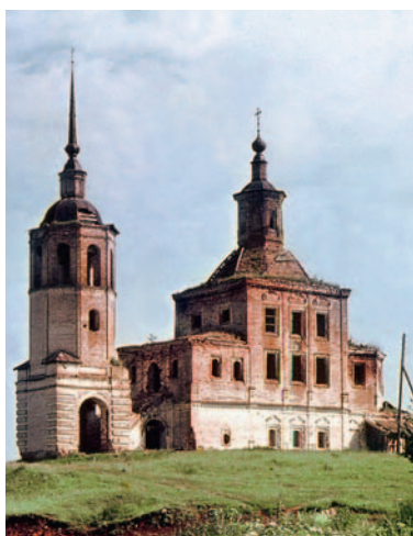
Иллюстрация 5. Троицкая церковь в с. Вотлажма Архангельской обл.

менялся почти всегда в центрических ярусных композициях. Следовательно, на далекой Вычегде получилось своеобразное сочетание.