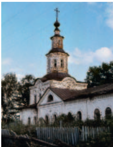
Иллюстрация 9. Богородицкая церковь Усть-Недудомского монастыря Кировской обл.