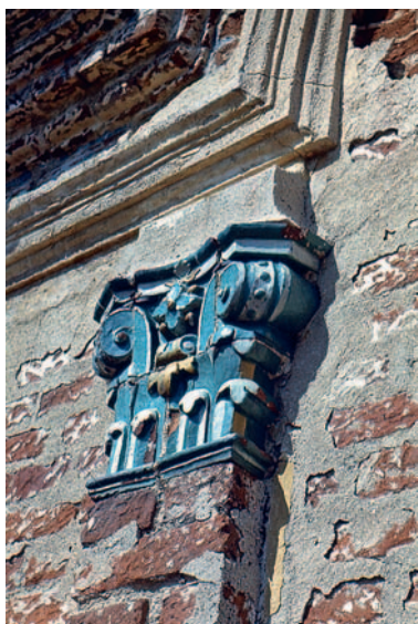
Иллюстрация 11. Богоявленская церковь в с. Яхреньга Кировской обл. Деталь