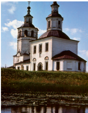
Иллюстрация 8. Спасо-Преображенская церковь в с. Слобода Кировской обл.