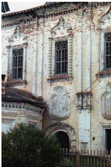
Иллюстрация 3. Троицкая церковь в с. Червково Архангельской обл. Фрагмент