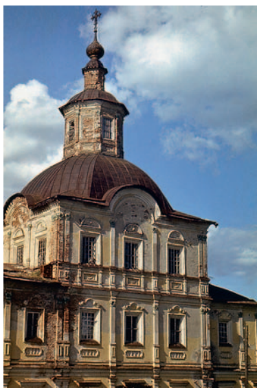
Иллюстрация 12. Богоявленская церковь в с. Яхреньга. Фрагмент