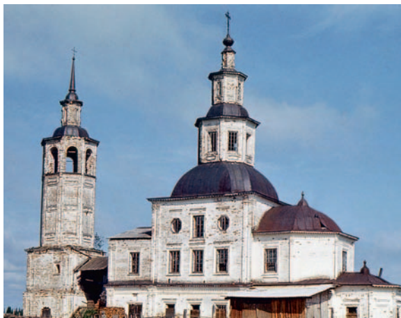
Иллюстрация 6. Троицкая церковь в с. Вожем Архангельской обл.