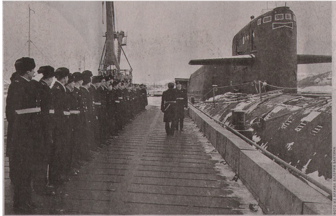
В разное время на АПЛ «Борисоглебск» прослужили более 6 тысяч моряков из разных уголков России.

АПЛ «Борисоглебск» построили по проекту 667 БДР «Кальмар» и сдали ВМФ в 1979 году. Субмарины данного типа оснащены 16 пусковыми установками, а главным их вооружением являются межконтинентальные баллистические ракеты Р-29Р дальностью до 6500 километров. Длина подлодок проекта составляет 155 метров, подводное водоизмещение — 16 тысяч тонн, скорость — 24 узла, глубина погружения — 450 метров, автономность плавания — 90 суток. Экипаж состоит из 130 человек. Всего по проекту 667 БДР было построено 14 субмарин. Часть из них до сих пор стоит на вооружении ВМФ России.