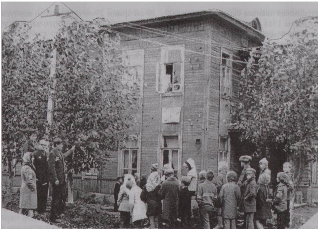
Вторичная репродукция: бывший Дом колхозника в Котласе, где размещался штаб 28-й НКВД при формировании в 1941-1942 годах.