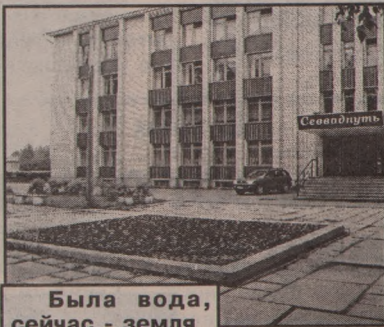
Была вода, сейчас - земля

Что украшает внешний облик города? В душный летний день - работающий городской фонтан. А ведь когда-то были они у нас! Давайте вспомним.