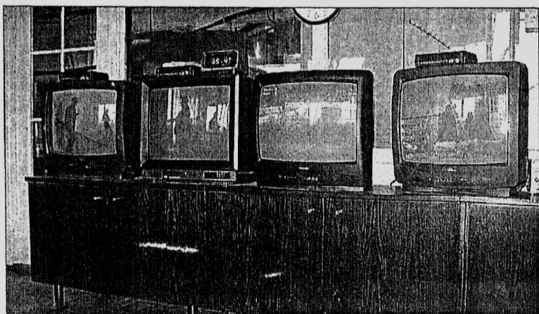
Мелодрама, новости и юмор – нехитрый набор современного TV