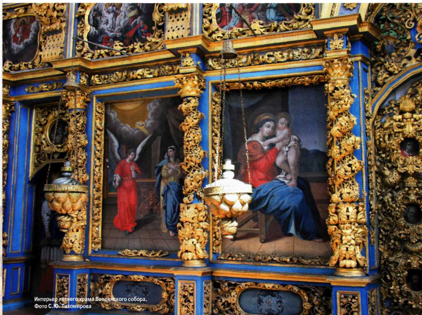
Интерьер летнего храма Введенского собора.

Зинаида Мехреньгина Сольвычегодский историко-художественный музей