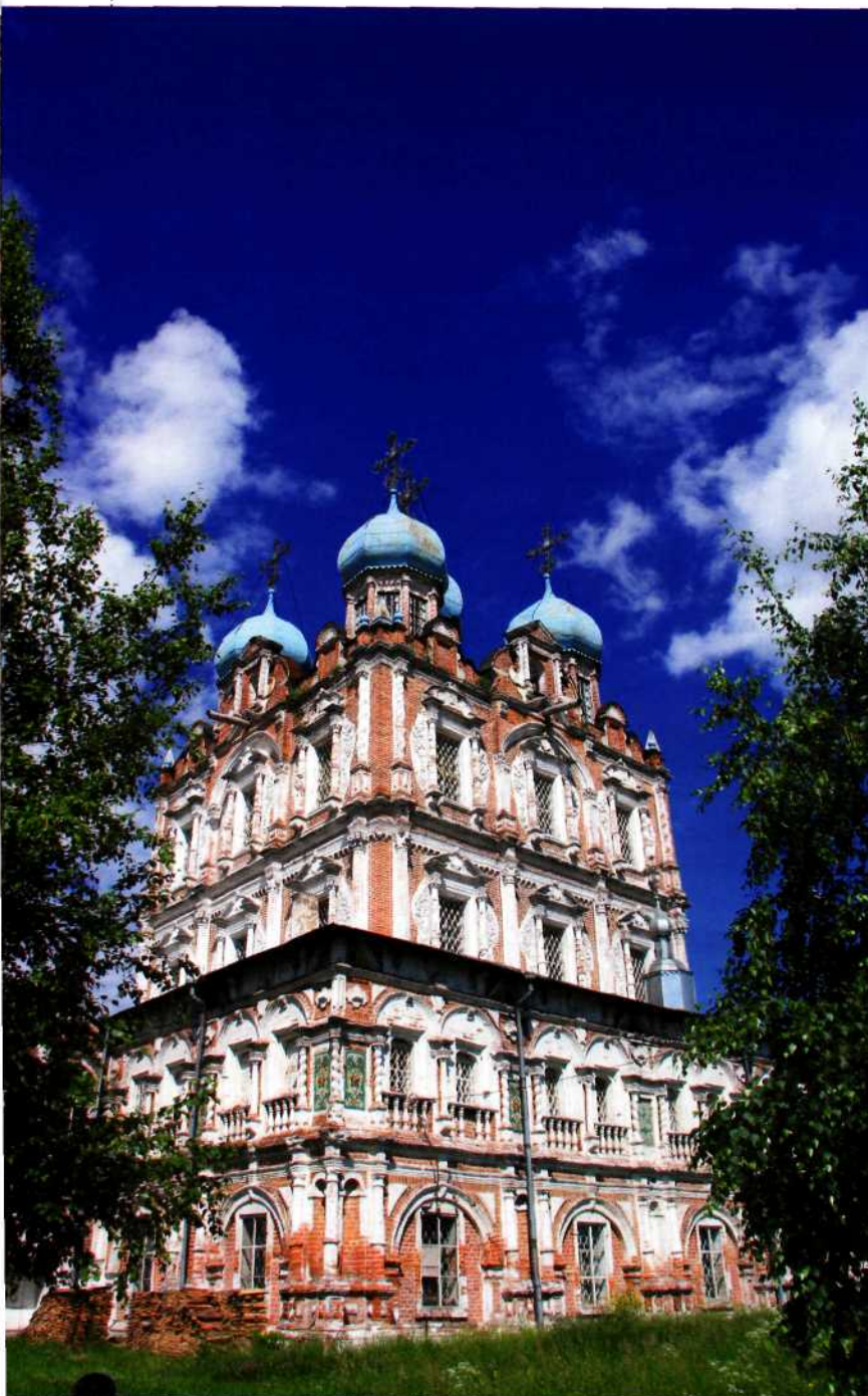
Введенский собор.

ется крупное каменное здание усадебного типа – дом купцов Пьянковых, сооруженный в первой трети XIX в. Его архитектура носит типичный для позднего классицизма характер.