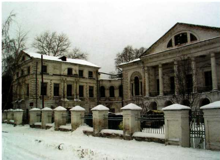
Дом купцов Пьянковых

ты мастерства, которыми в совершенстве владели их бабушки и прабабушки.