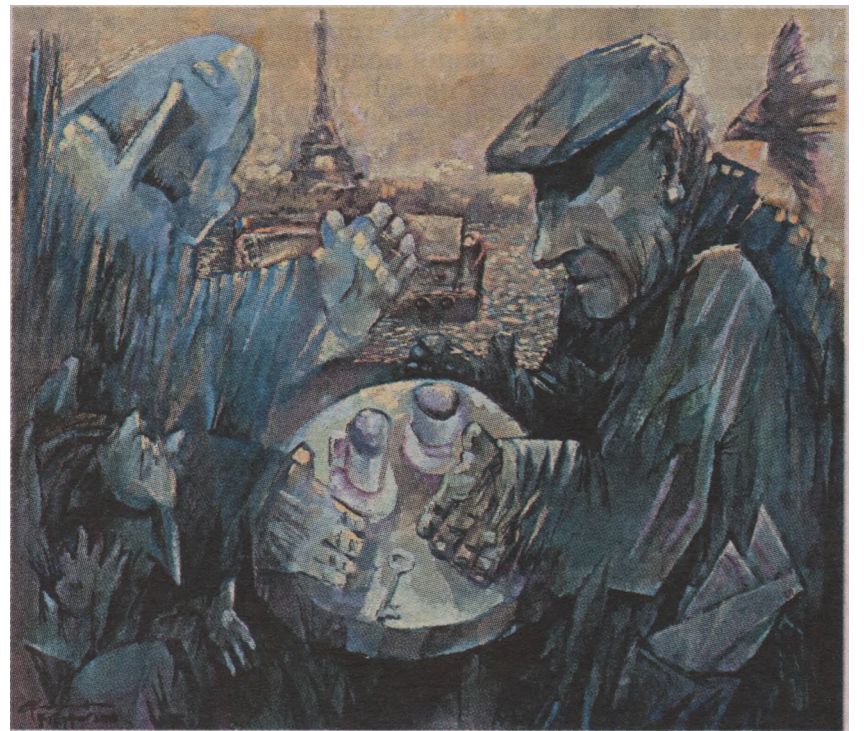
Встреча в Париже, 2010