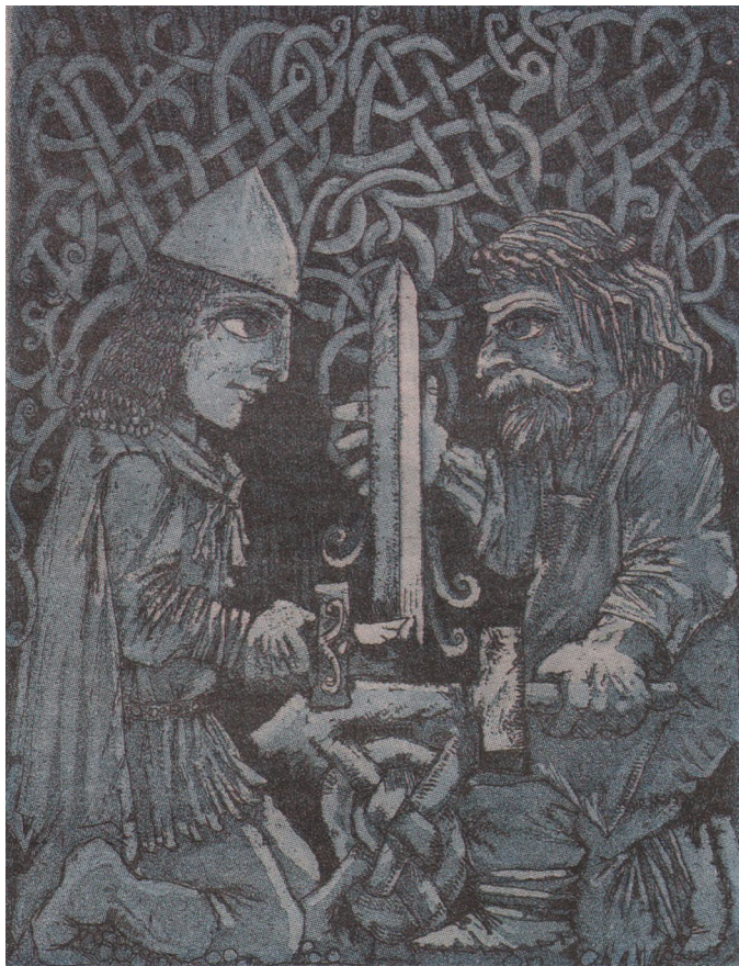
«Старшая Эдда». Сигурд и Регин, 2010