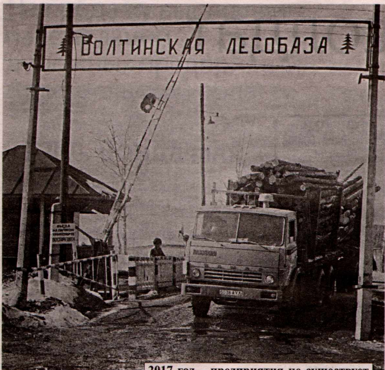
2017 год – предприятия не существует.