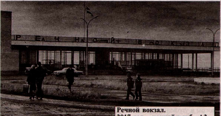
Речной вокзал. 2017 год – ночной клуб «А3».