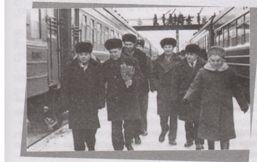
1976 - присвоено звание «Герой Социалистического Труда». Возвращение из Москвы.