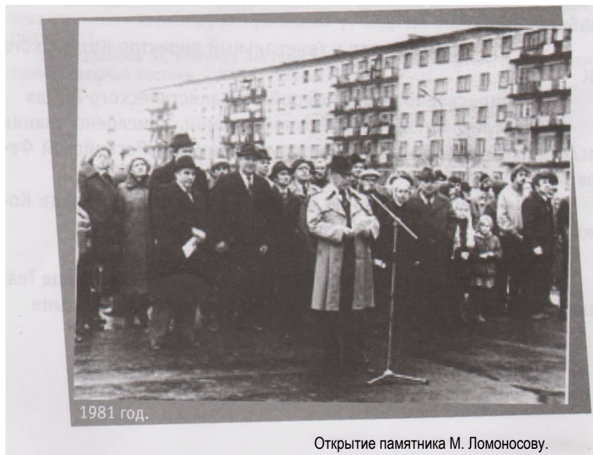
Открытие памятника М. Ломоносову.