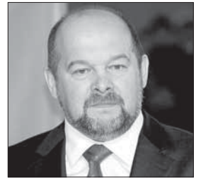
Игорь Орлов, губернатор Архангельской области:

– Создание лесопромышленного кластера – это значимое событие в экономике и социальном становлении региона, а также в позиционировании Архангельской области как центра развития ЛПК на всероссийском уровне.