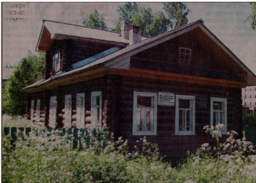
В этом доме жил Сталин во время своей второй ссылки в Сольвычегодск.