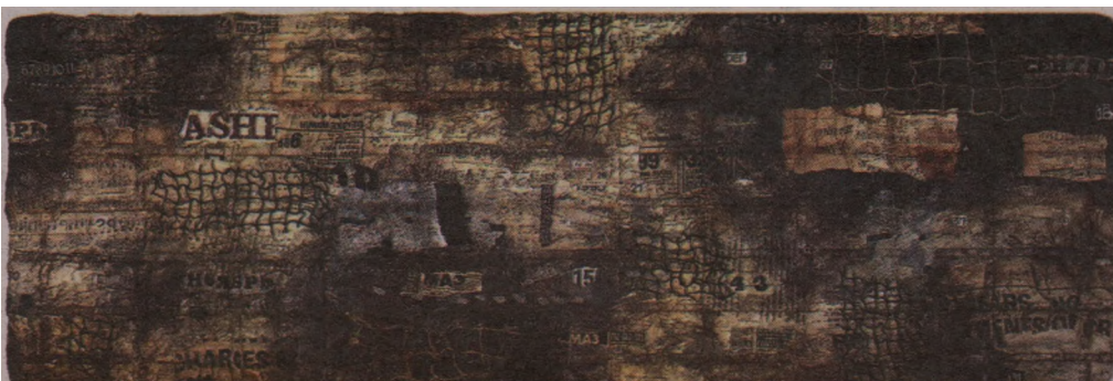
ВЧЕРА. ДИПТИХ. 2000