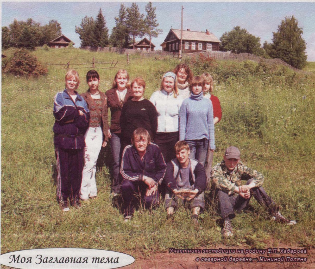
Моя Заглавная тема