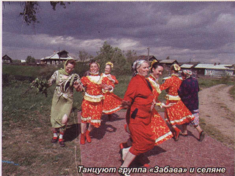
Танцуют группа «Забавы» и сельчане

Главное, много туристов, всем нравится. Важно, по прошлому году, туристы, держа путь в город Великий Устюг, заезжали на фестиваль - за порцией необычных впечатлений. И этой дополнительной культурной составляющей не