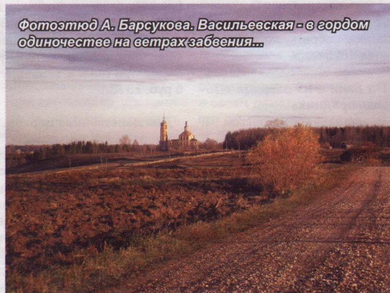
Васильевская - в гордом одиночестве на ветрах забвения...