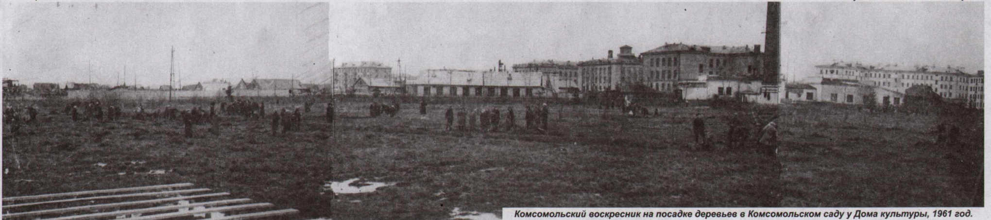
Комсомольский воскресник на посадке деревьев в Комсомольском саду у Дома культуры, 1961 год.