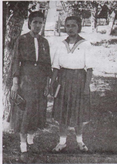
Мама и дочь, 17 июля 1947 года.