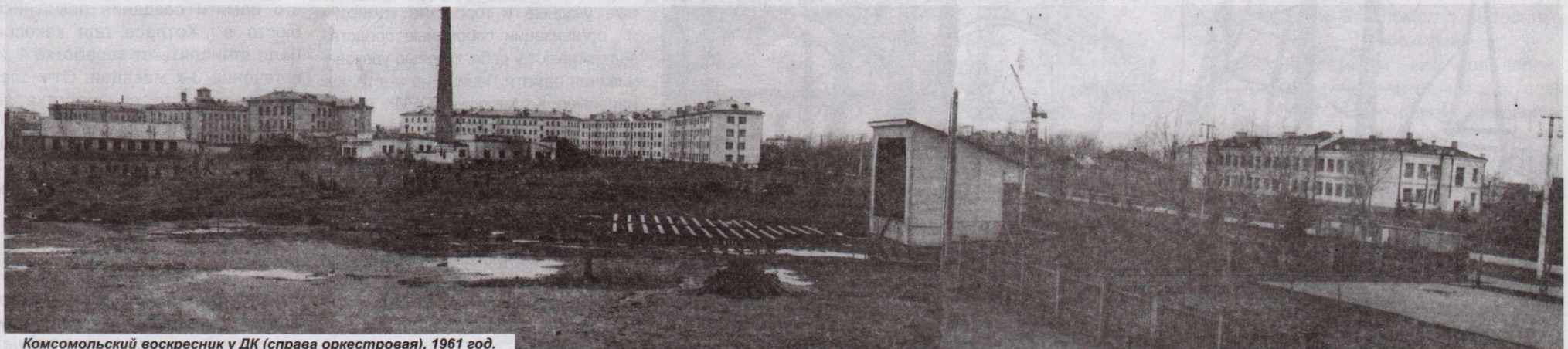
Комсомольский воскресник у ДК (справа оркестровая), 1961 год.