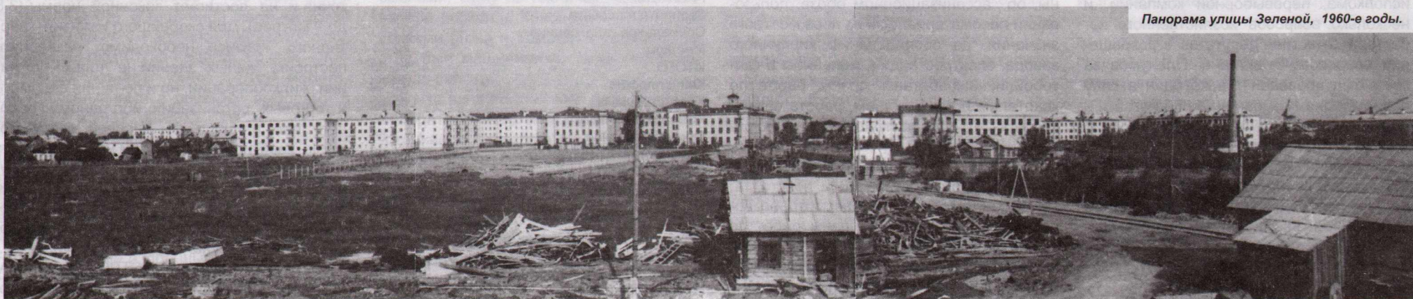
Панорама улицы Зеленой, 1960-е годы.