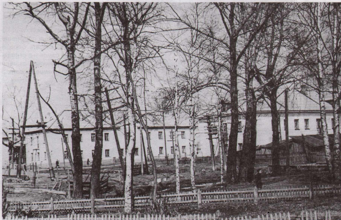
Сквер около двухэтажной деревянной телефонной станции, видны ж.д. дома Печорской ж.д.