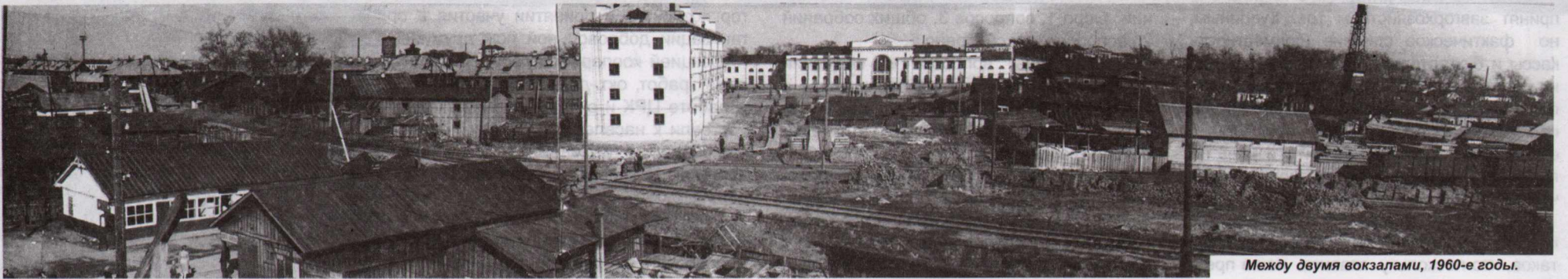
Между двумя вокзалами, 1960-е годы.

Продолжение. Нач. на стр. 2. на Лименде, есть план и смета постройки в 185,200 р., утвержденная Гупланом, но нет средств, запрошенных 150-100 тысяч руб. (из центра обещает помочь В-Устюгский Комбанк и Сельбанк до 50 000 руб. и если дадут эти деньги, то в текущем году будут заготовлены кой-какие материалы и будет закуплена часть машин. Вот каково состояние, какова перспектива в области благоустройства и нового строительства.