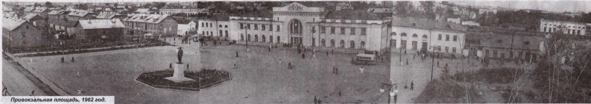
Привокзальная площадь, 1962 год.