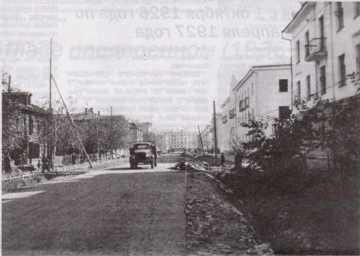
Улица Луначарского, 1950-е годы.