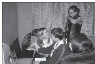
Местное издательство. Выпустить газету за два дня – это вам не шутка!