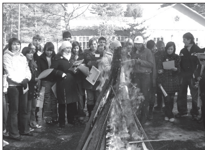
“Гори, гори ясно, чтобы не погасло!” Традиционная сходка жителей Зоравграда.