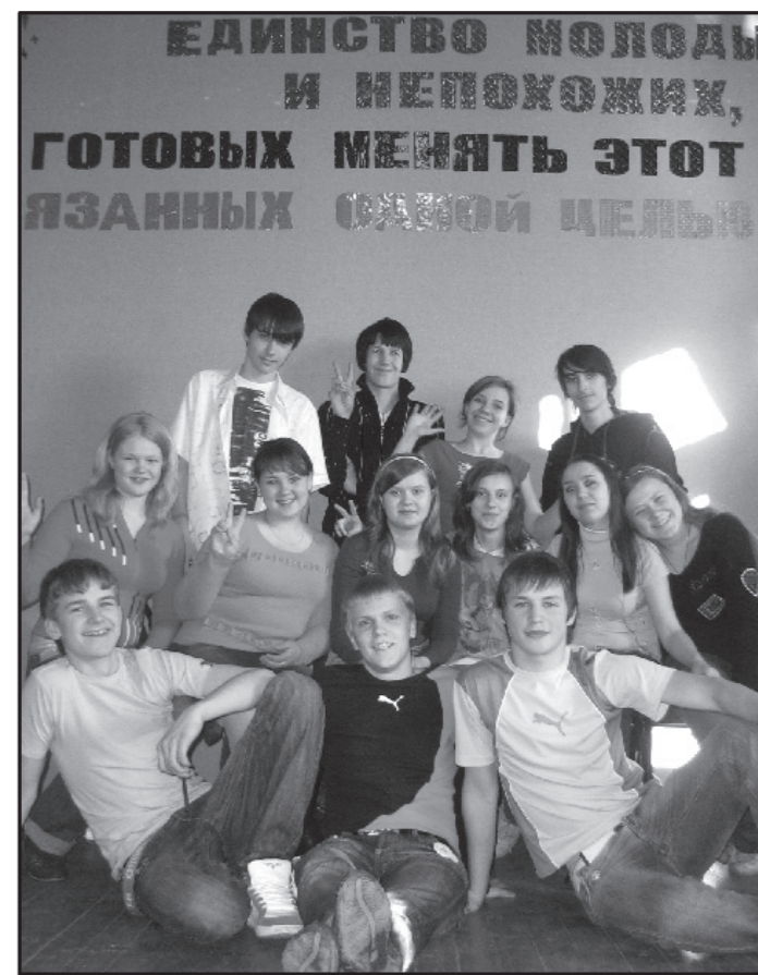
Мы связаны одной целью и готовы менять этот мир.

После обеда прошла АРТ-Терра, на которой, помимо дискотеки, состоялось награждение активистов. Кульминацией дня было подведение итогов сбора: выносилась оценка «Веснянке», командирам отрядов, выбирался лучший день, лучшее дело и т.д. Но самое сильное впечатление произвел последний орлянский круг. Мы не пели много песен.