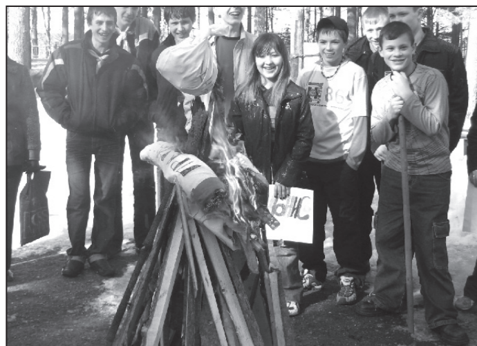
Акция “Живи! Люби! Твори!”: символическое сжигание вредных привычек. В борьбе с ними все средства хороши.