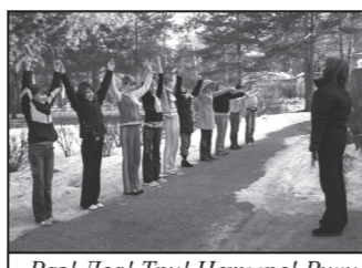
Раз! Два! Три! Четыре! Руки вместе, ноги шире!