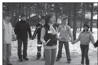
Тренинг на командообразование. Все только начинается.