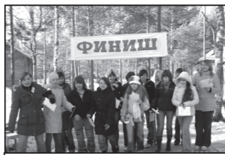
Ориент-шоу: прежде чем достигнешь цели – искупайся в сугробе.