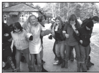
Самый лучший способ сблизиться – скрепить ноги скотчем.