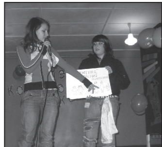
“Слушайте, здравградцы! Закон № 1”. Совместная разработка прав и обязанностей.