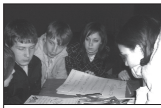
Ролевая игра-конференция “Красота тела через здоровье”.