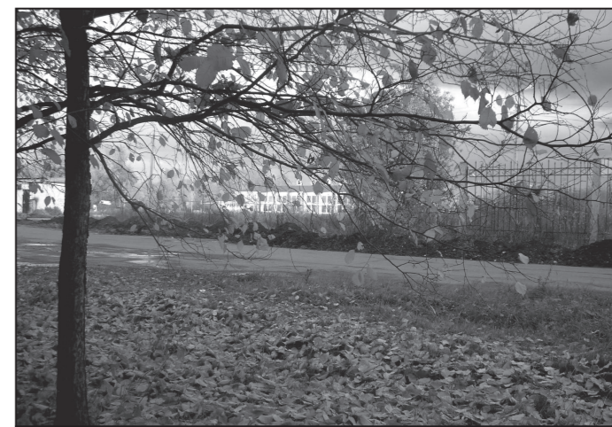
1 место – София Козловская, «Золотая пора».