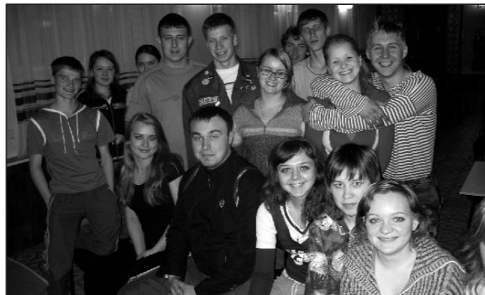
Лидеры СО в неформальной обстановке (в общезимней КФ АГТУ)