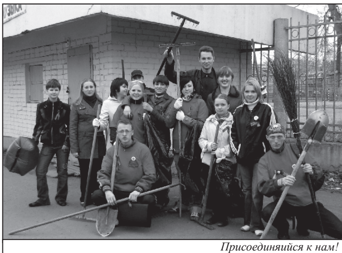
Присоединяйся к нам!

Восьмого мая в 16.00 возле спорткомплекса «Локомотив» началась акция «За чистый город!» Организаторами являлись