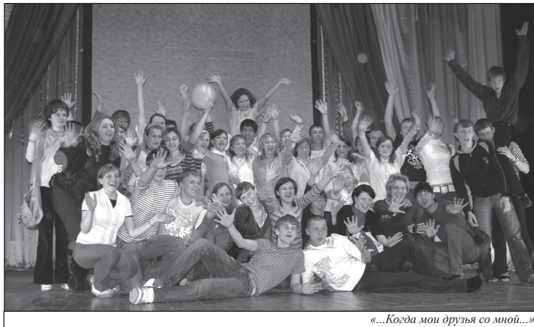
«...Когда мои друзья со мной...»

«Юниор» – это Юные, Настойчивые, Инициативные, Оптимистичные Ребята. Что они и продемонстрировали своим гостям. Рассказав все-все о себе, приготовились получать подар-