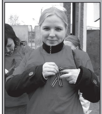
Идею подхватил молодежный парламент.

Подробнее об акции на сайтах «Наша Победа» www.9may.ru и www.cco.ru