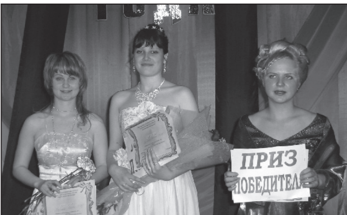
Счастливые обладательницы титулов «Студент года» и стипендий мэра

Во время первого конкурса, «визитной карточки», каждый из студентов