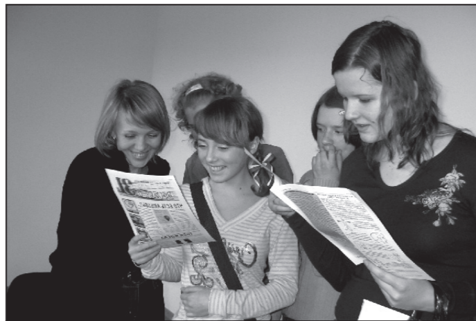
Себя показали, посмотрим на других (обмен опытом на выставке газет).