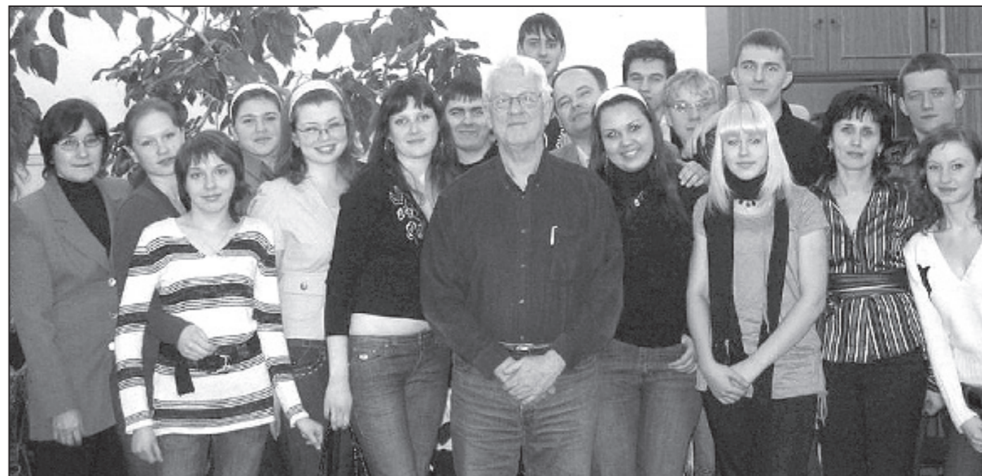
«Гора» и «Магомеда».