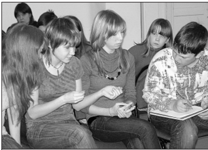
«Где эта улица, где этот дом?» (Клуб «Юниор»).

В Котласском краеведческом музее собрались ребята из подростковых клубов детско-юношеского центра – «Спектр», «Эверест», «Дружба», «Юниор» и пресс-клуба «Орион». «Северная глубинка» проводится раз в два года и включает в себя самые разнообразные темы из жизни нашей малой родины. В этот год участники конкурса показали свои знания в области истории 13 котласских героев Советского Союза.