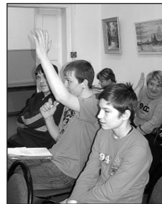
Спросите меня! Клуб «Дружба».

сов просто необходимо. Они поддерживают в нас пламя особого, ничем не заменимого, огонька патриотизма к родным местам.