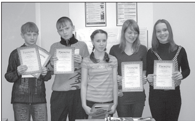
Команда победителей из 7а класса школы № 91.

14 марта прошел конкурс школьных газет. Жюри в составе профессиональных журналистов из го-