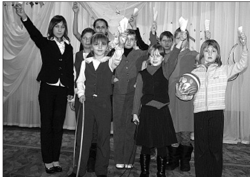
Школа № 5 против наркотиков!

Наша сегодняшняя жизнь довольно разнообразна и насыщена, однако, не без проблем. Одна из них, не первая и не последняя по важности, – проблема, связанная с курением, употреблением алкоголя и прочими вредными привычками. К сожалению, этим увлекается подавляющее число молодежи, у каждого находят свои причины.