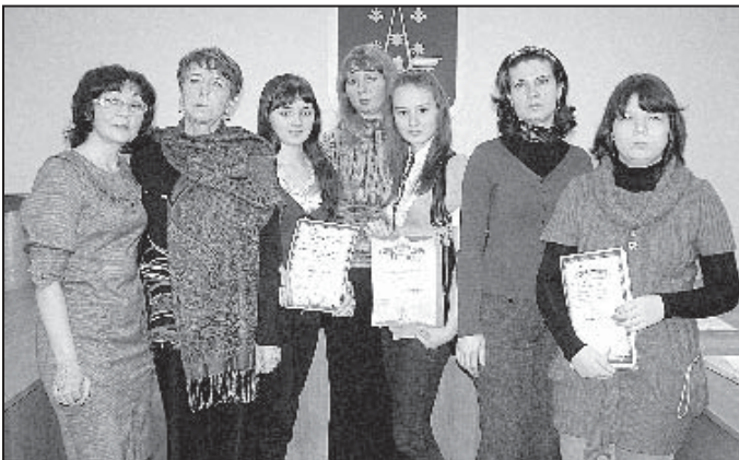
Жюри и победители конкурса «Первый штрих».

Приглашаем молодых активных людей от 18 до 30 лет для работы волонтерами на конкурсе вокалистов «Серебряные трели». За более подробной информацией обращайтесь по телефону 3-26-80 (МОУ ДОД «Детско-юношеский центр», Кедрова 12-а).