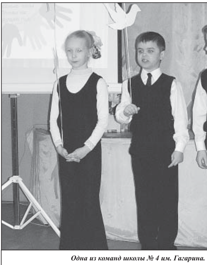
Одна из команд школы № 4 им. Гагарина.

«Мы имеем право, мы – дети!» – требовательно заявили ученики школы № 4 имени Гагарина, участники акции «Я – гражданин России». Формирование активной гражданской позиции и стимулирование интересов молодого поколения к решению актуальных проблем – вот цель этого проекта. Он проходит уже седьмой год ученики разных школ и организаций активно участвуют в акции.