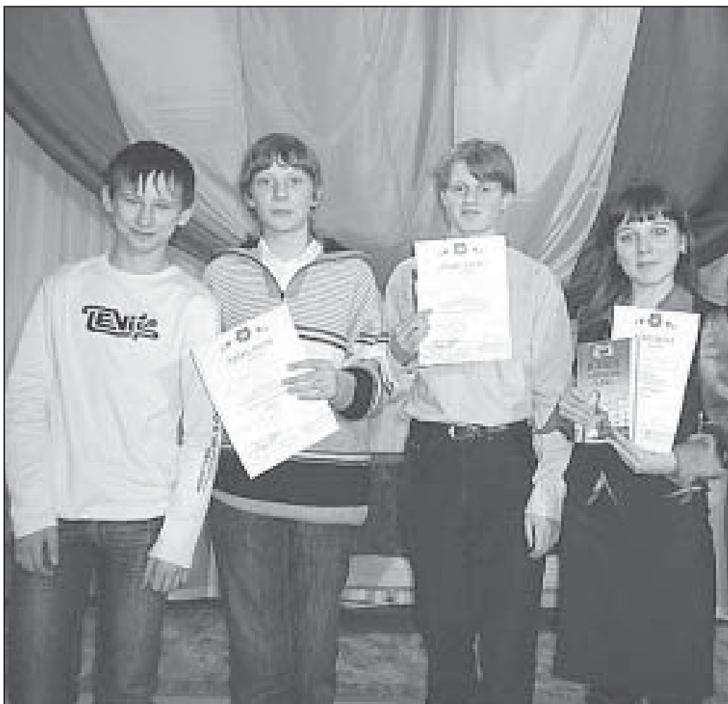
Участники секции языкознания.