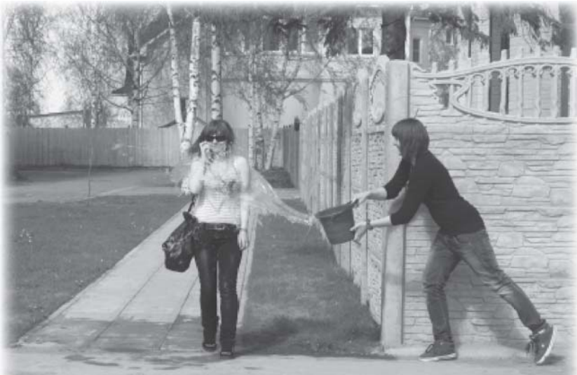
Ради «Фотошока» и подругу «замочить» не жалко! (Команда «3D»)

Думаю, это был хороший шанс сблизиться с окружающим миром. Мы начинаем замечать то, мимо чего раньше прошли бы мимо. Например, замершая капля дождя на кончике ветки или упавший в лужу листок. Красота окружает нас повсюду, только мы порой закрываем глаза, пробегая мимо по своим неотложным делам. А стоит замедлить шаг, оглядеться вокруг – и