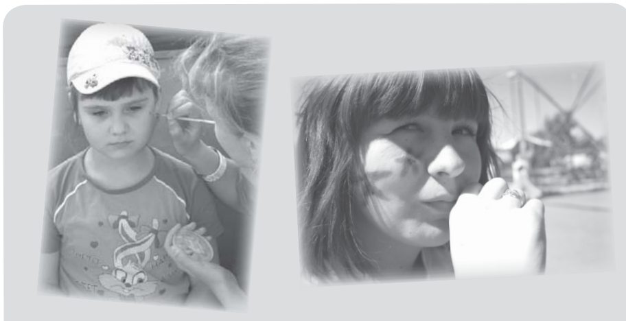
Среди ребят в День защиты детей было очень популярно рисование на лицах.