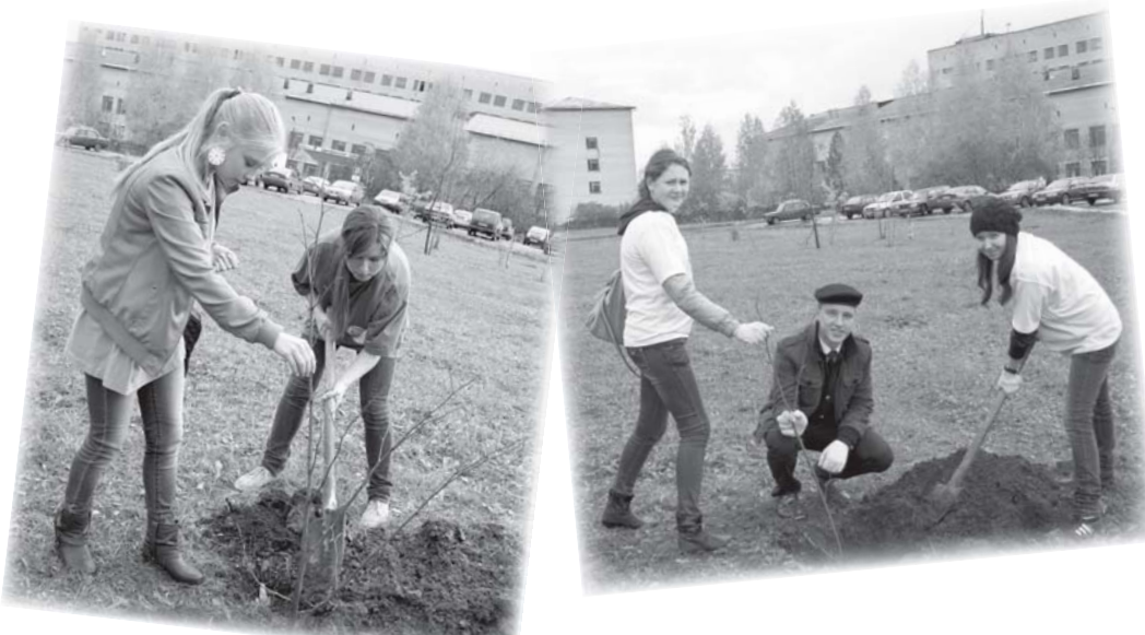
Посадка Ломоносовской аллеи членами Молодежного парламента. Вот на кого равняемся, друзья!