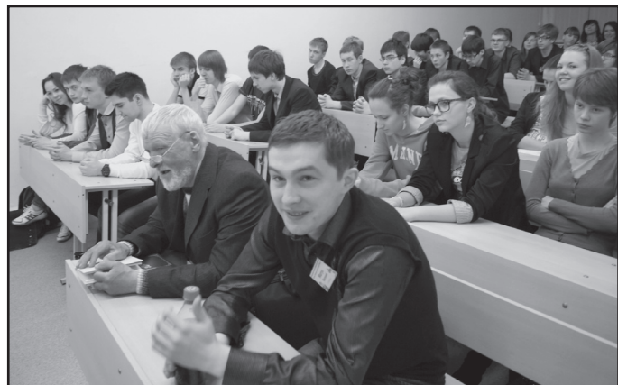
Встреча поэтов с учениками 11 класса Лицея №3.

только через освоение, изменение старого наследия. Думаю, что Север не уступает другим регионам: я работаю с начинающими писателями и поэтами, среди них есть