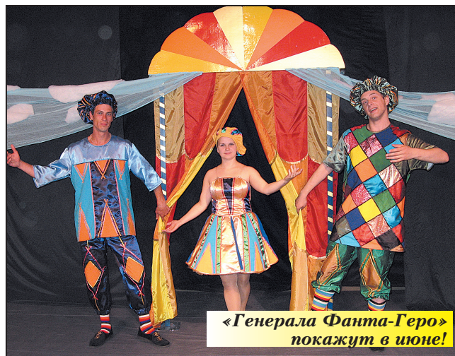
«Генерала Фанта-Геро» покажут в июне!