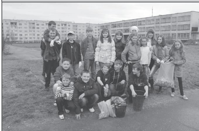
Субботник у второй школы, 5 «В» класс

23 мая в зале администрации МО «Котлас» состоялось торжественное закрытие, подведение итогов и награждение участников муниципальной акции «Весенний позитив», собравшее 20 представителей различных организаций. Инициатором акции в этом году выступил Молодежный центр, открывший ее 29 апреля. «Неделя добра» проходила по трем направлениям: «МОЛОДЕЖЬ – ГОРОДУ!» «МОЛОДЕЖЬ – ВЕТЕРАНАМ И ВОИНАМ!» и «МОЛОДЕЖЬ – ДЕТЯМ!».