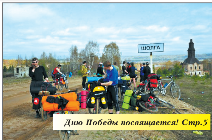
Дню Победы посвящается! Стр. 5

Старт действу дадут труппы из столицы Поморья. 9 июня в 17.00 Ар-