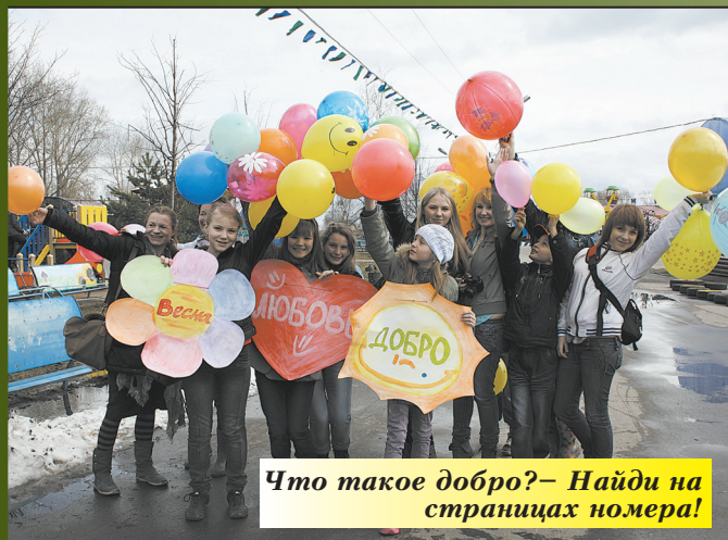
Что такое добро? – Найди на страницах номера!