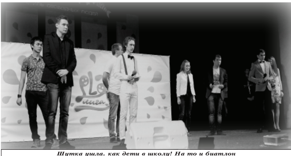
Шутка ушла, как дети в школу! На то и биатлон