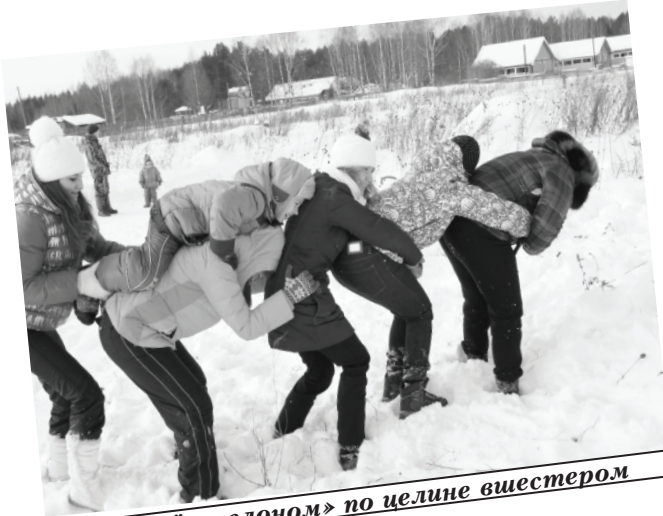
Мы идём «слоном» по целине вшестером