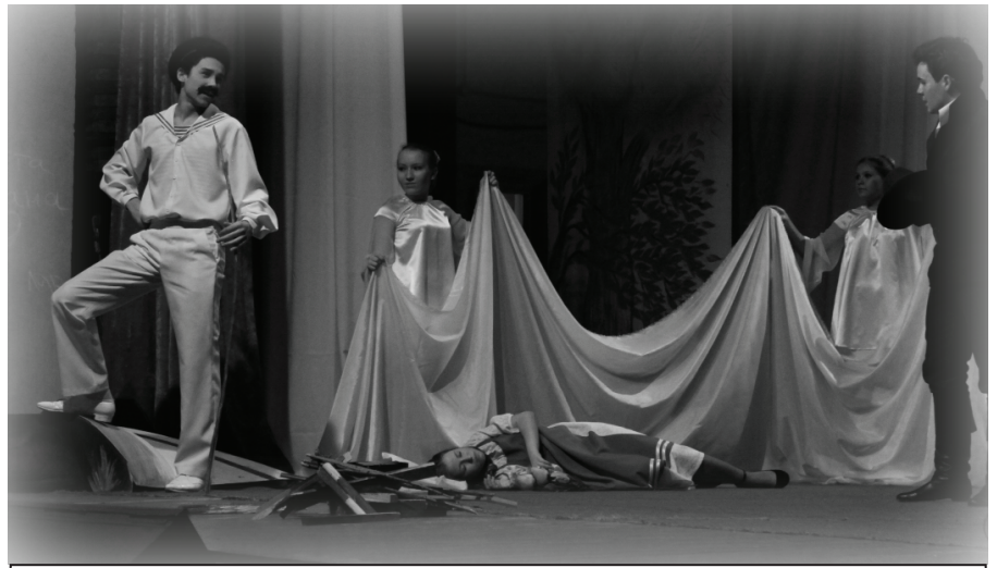
Сцена из спектакля. Грэй и Летка увидели в лесу спящую Ассоль

По мнению зрителей, ребята (средний состав) отработали на славу! В спектакле поднимались очень актуальные нравственные проблемы, помимо основных – борьбы за Мечту и Любовь. Кажется вполне естественным, когда из уст гриновских персонажей звучит проникновенное тютчевское: «Не то, что мните вы, природа...» Были моменты, когда хотелось всплакнуть, думаю, не только мне.