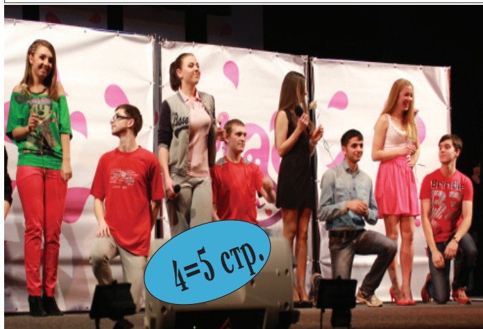
За «Девчатами» ребята ухаживали наперебой

11-12 февраля «экспериментальная кухня», развернувшаяся на базе Котласского театра драмы, угостила зрителей многими «вкусностями» из шуток, музыкальных мини-атю и видеосюжетов с начинкой. Приближающийся День всех влюблённых вдохновил многих юношей на подвиги.