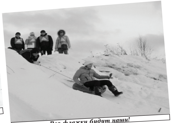
Все флажки будут наши!