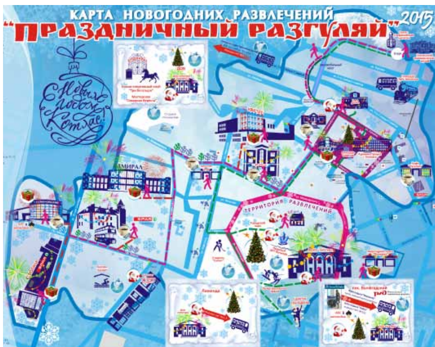
Карта в свободном доступе на kotlas-city.ru

18 января, 11:00 - День семейного отдыха «Все о зиме». ККМ.