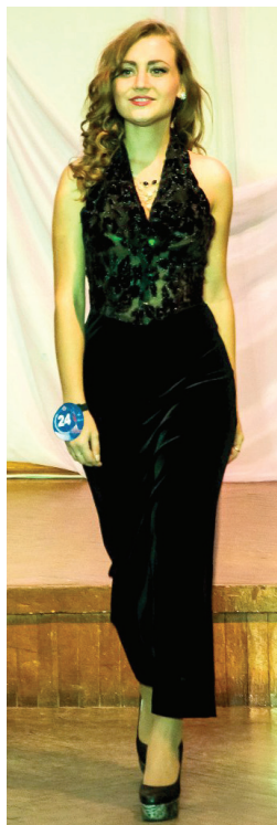
Твой образ жизни – «сова»?

– Про своё увлечение диджейством расскажи?