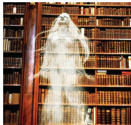
В сценарии квеста - интеллектуальные задания

Все без исключения рассказывают, что ощущения такие, которых ты никогда не испытывал. Многие здесь поборолась со своими страхами. А самый сильный из них - ока-