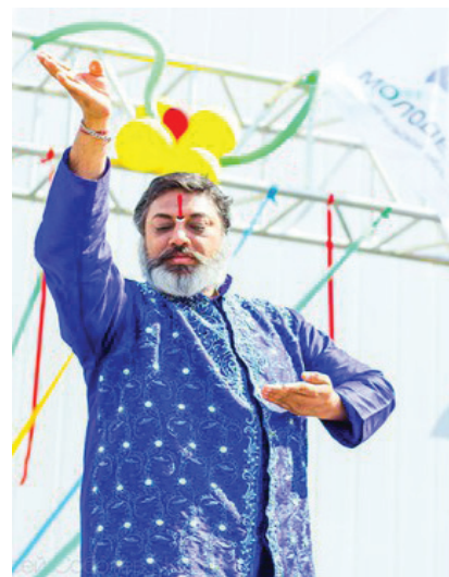
Гость из Индии приехал к нам с приветом