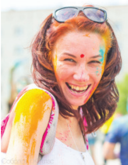
Красочные эмоции НОЛИ