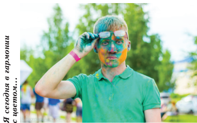
Я сегодня в гармонии с цветом...