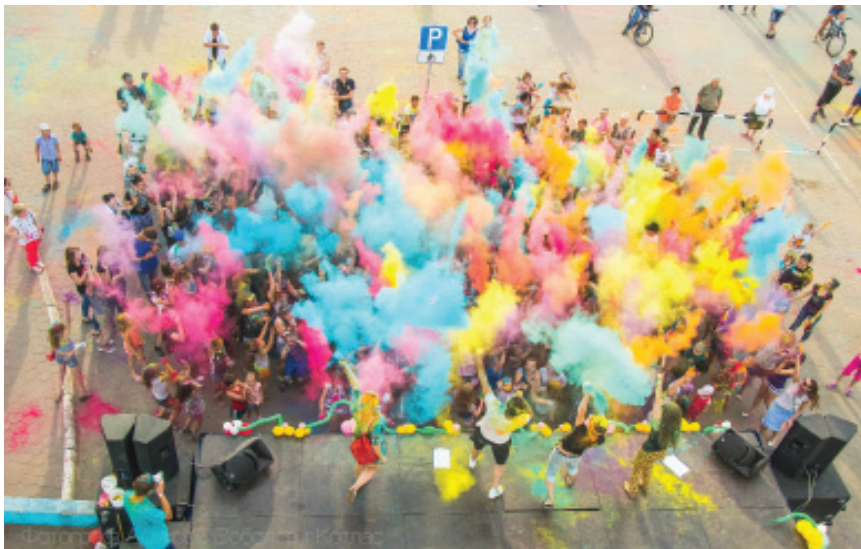
Последний залп ярких красок