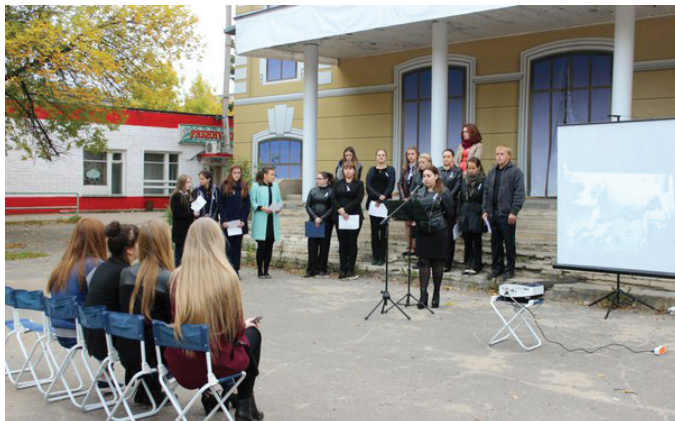
В знак памяти участники акции запустили в небо воздушные шары