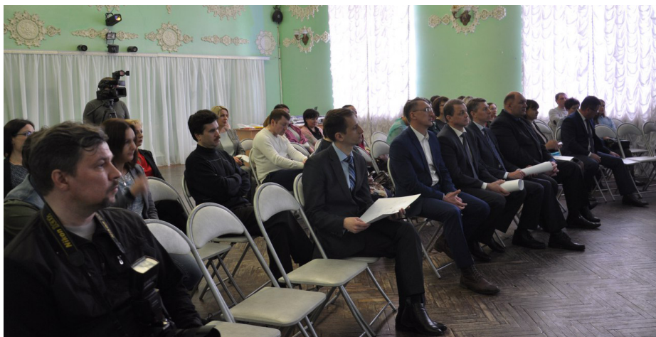
Презентация брендбука собрала глав шести муниципальных районов