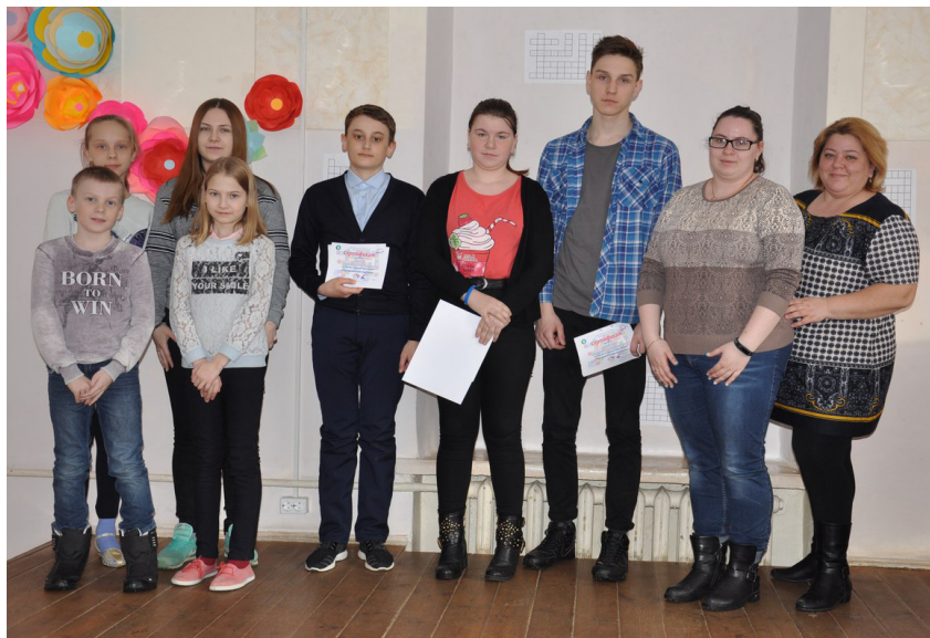
Самые активные участники конкурса