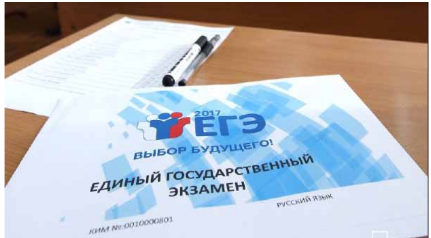
Наверное каждый получал такой конверт

но понять, наиболее большая тяга у меня была к литературе и вообще всему, что связано с языком.