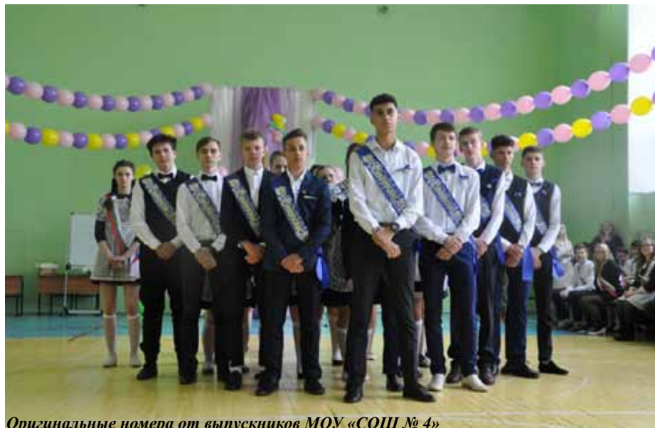
Оригинальные номера от выпускников МОУ «СОШ № 4»