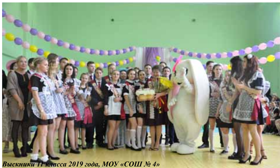
Выпускники 11 класса 2019 года, МОУ «СОШ № 4»

Художественная часть праздника не должна быть большой: эмоциональный накал прощания со школой не стоит топить в заурядном выступлении школьного хора или выступлении тех, кто занимается аэробикой. Лучше пусть это будет небольшой капустник, подготовленный специально для выпускников ребятами следующего за ними 10-го класса. Сюда войдут сценки из школьных будней, частушки на школьные темы. И хотя в этот день все для выпускников, а они – лишь благодарные зрители, но