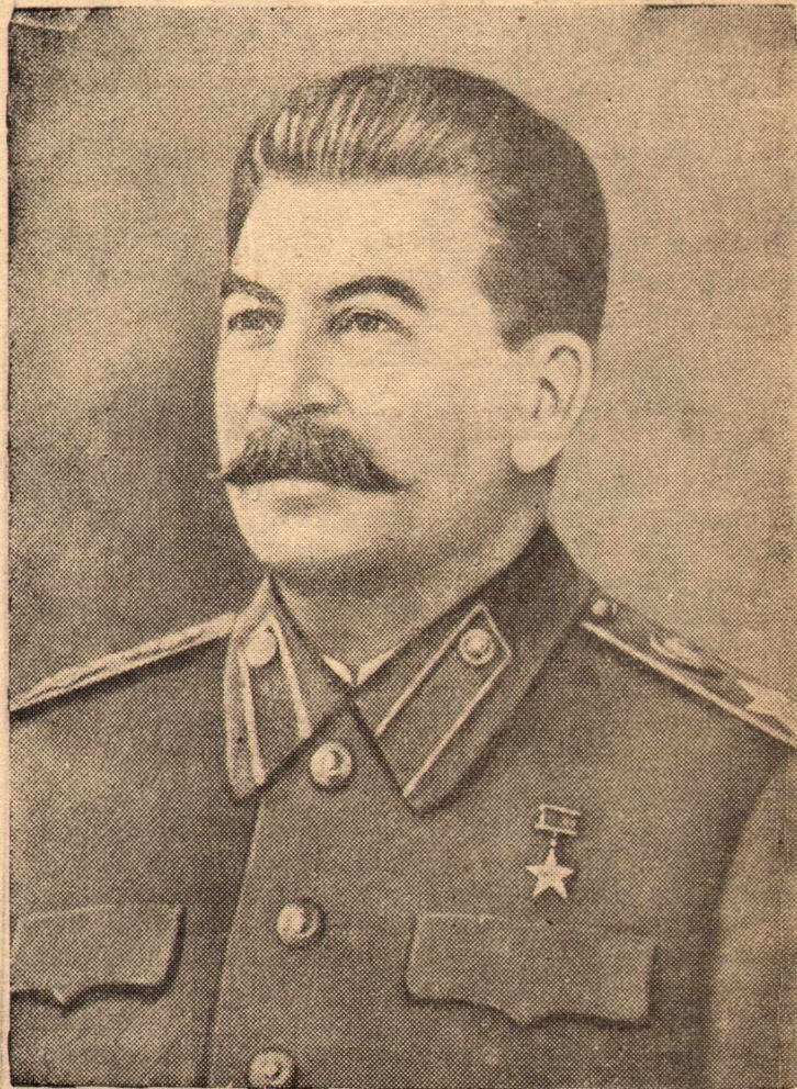
Председатель Совета Министров Союза ССР Генералиссимус Советского Союза Иосиф Виссарионович СТАЛИН