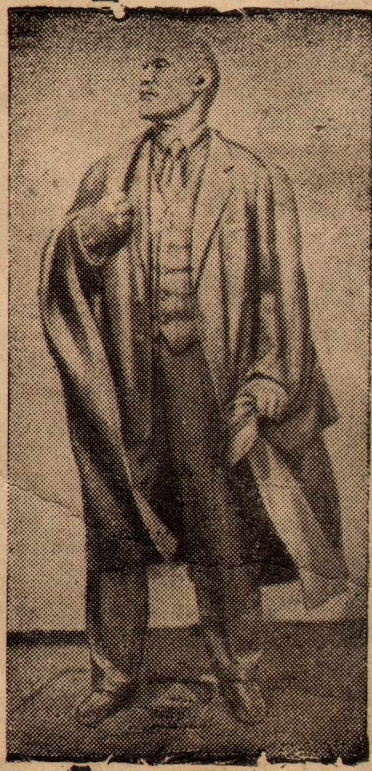
Ленинградский завод „Монументалькультура“ закончил отливку двухметровой бронзовой фигуры В. И. Ленина работы лауреата Сталинской премии М. Г. Манизера. Скульптура В. И. Ленина будет установлена в городе Николаеве на месте памятника, разрушенного немецко-фашистскими оккупантами. На снимке: скульптура В. И. Ленина.