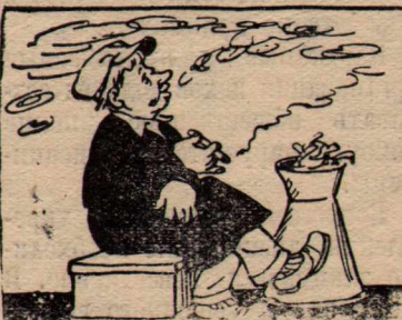
... потому, что этот много сидит.

Член ВКП(б) тов. Королев был выделен агитатором электросварочного цеха, он бесед в цехе не проводит.