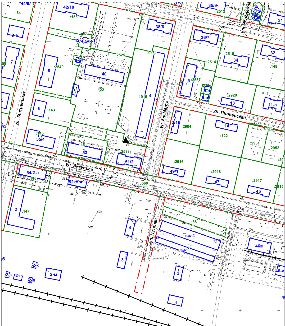
Схема размещения места (площадки) накопления твердых коммунальных отходов на территории городского округа "Котлас" ул. 8 Марта, 4 МАСШТАБ 1:2000