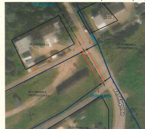
СХЕМА расположения границ публичного сервитута