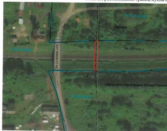
СХЕМА расположения границ публичного сервитута

Глава городского округа «Котлас» С.Ю. Дейнеко