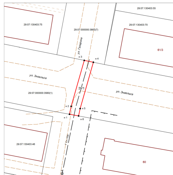
СХЕМА расположения публичного сервитута М 1:500

Постановлением администрации городского округа «Котлас» от «19» июля 2023 года № 1680