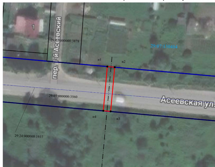
СХЕМА расположения границ публичного сервитута

Прокладка и эксплуатация газопровода высокого давления в полосе отвода автомобильной дороги общего пользования регионального значения IV-ой технической категории «Чекшино-Тотьма-Котлас-Куратово» на участке км 459+ 035, с кадастровым номером 29:07:000000:3560(1)