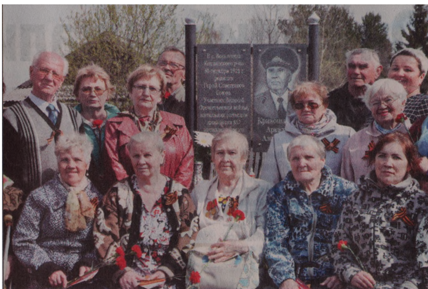
Вспомнить подвиг Героя Советского Союза приехали накануне Дня Победы около пятидесяти земляков.