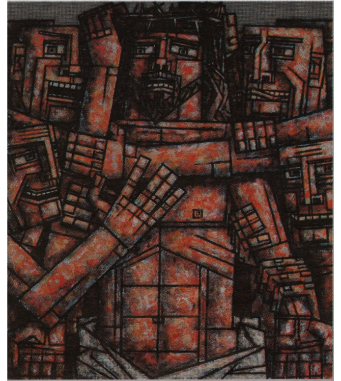
Коронавание терновым венком, 2011