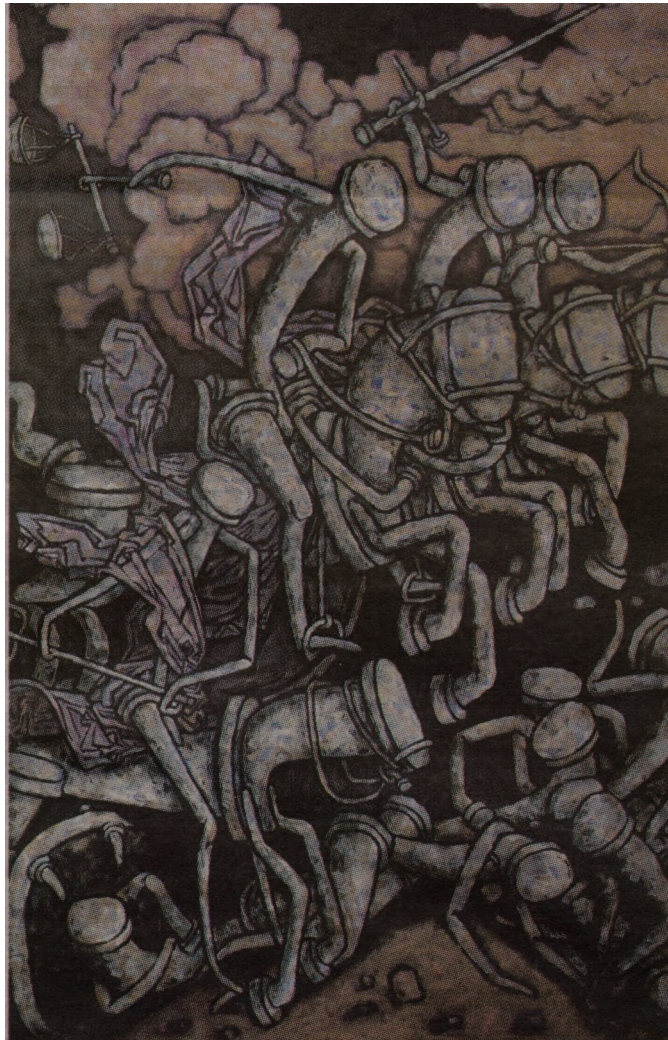
Всадники Апокалипсиса. По Дюреру, 2009