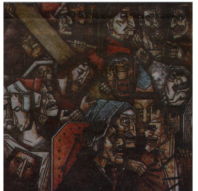
Несение креста. По Босху, 2012