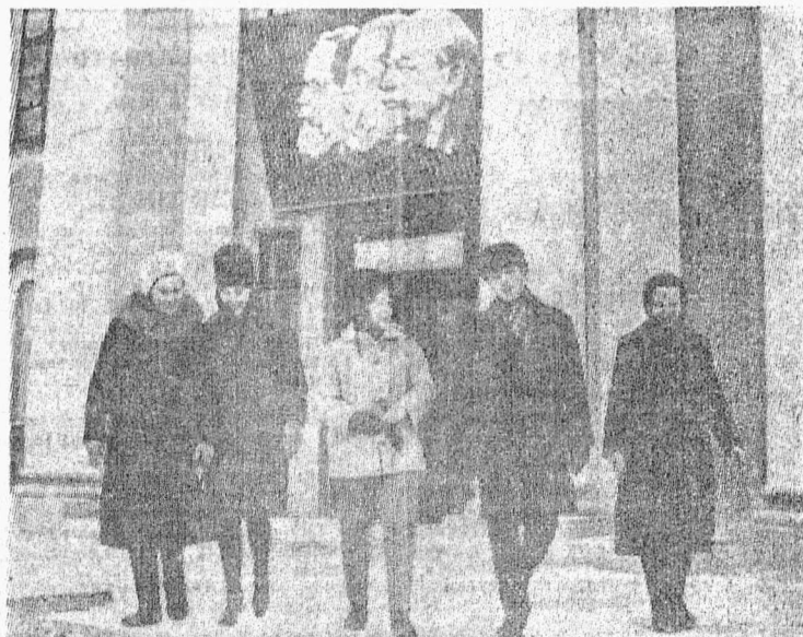
На снимке: участники художественной самодеятельности дома культуры.